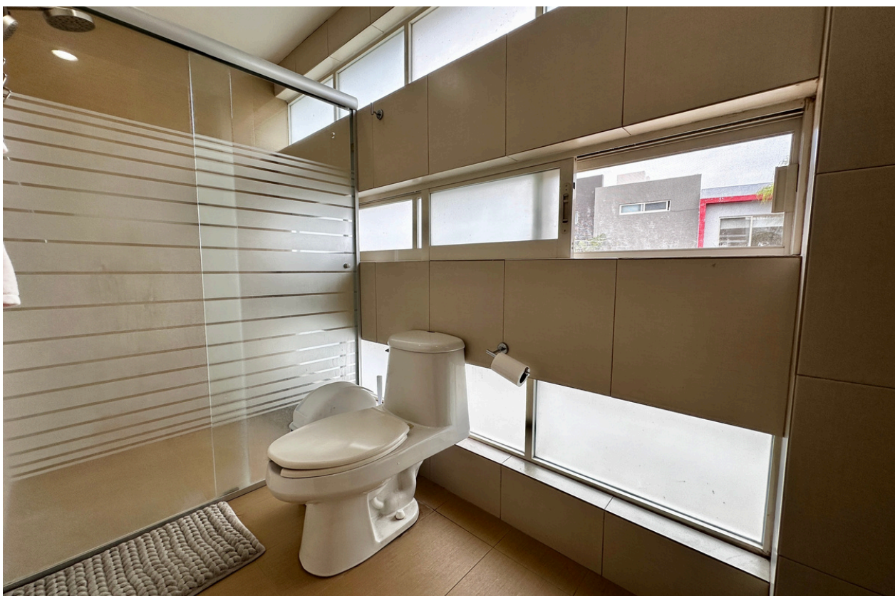
BAÑO COMPLETO RECÁMARA 2