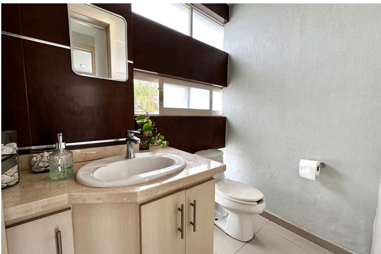
BAÑOS DE VISITAS