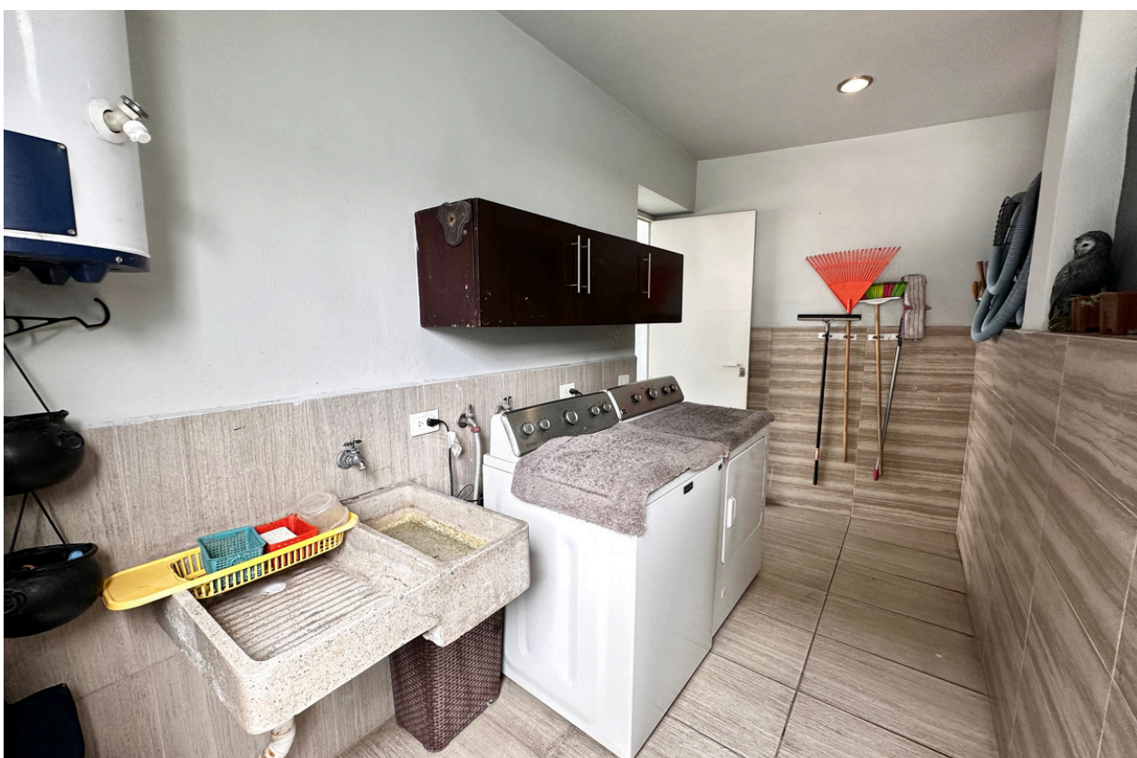
ÁREA DE LAVADO