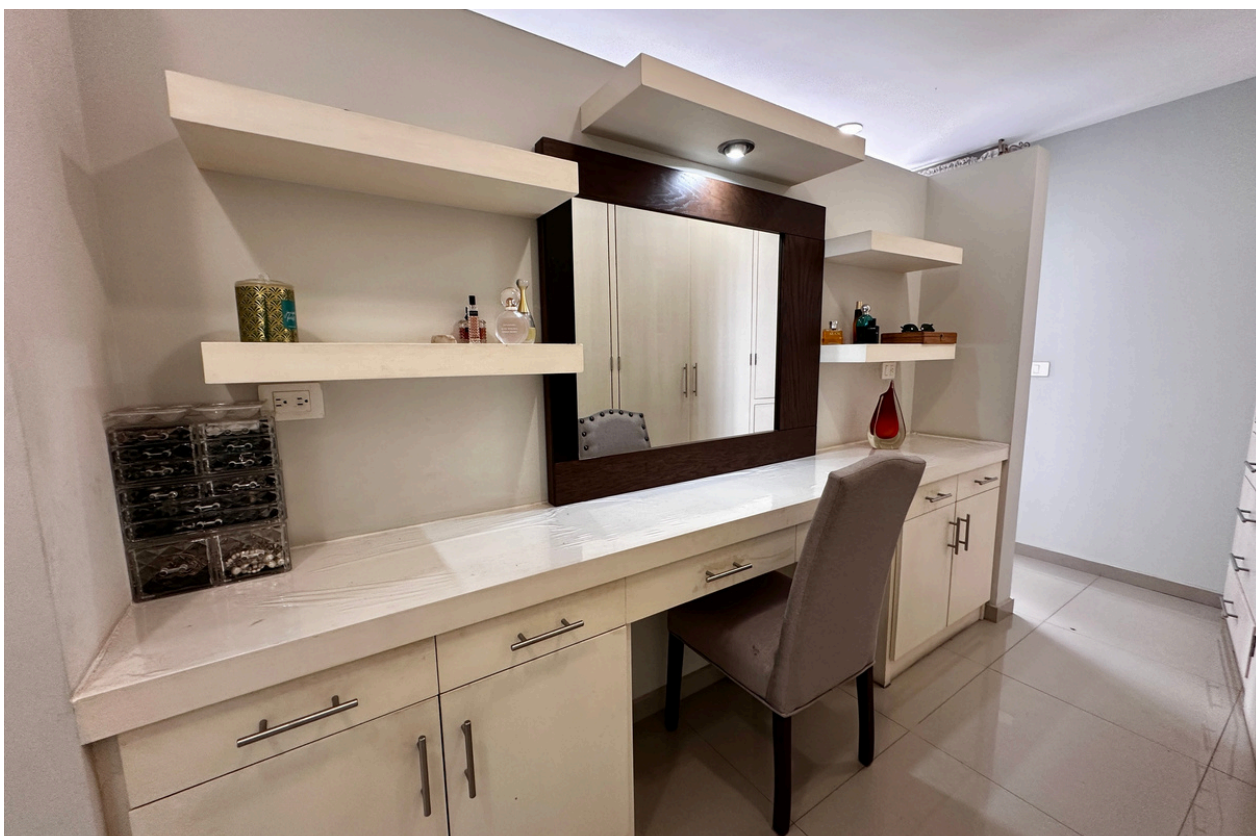
TOCADOR - VESTIDOR RECÁMARA PRINCIPAL