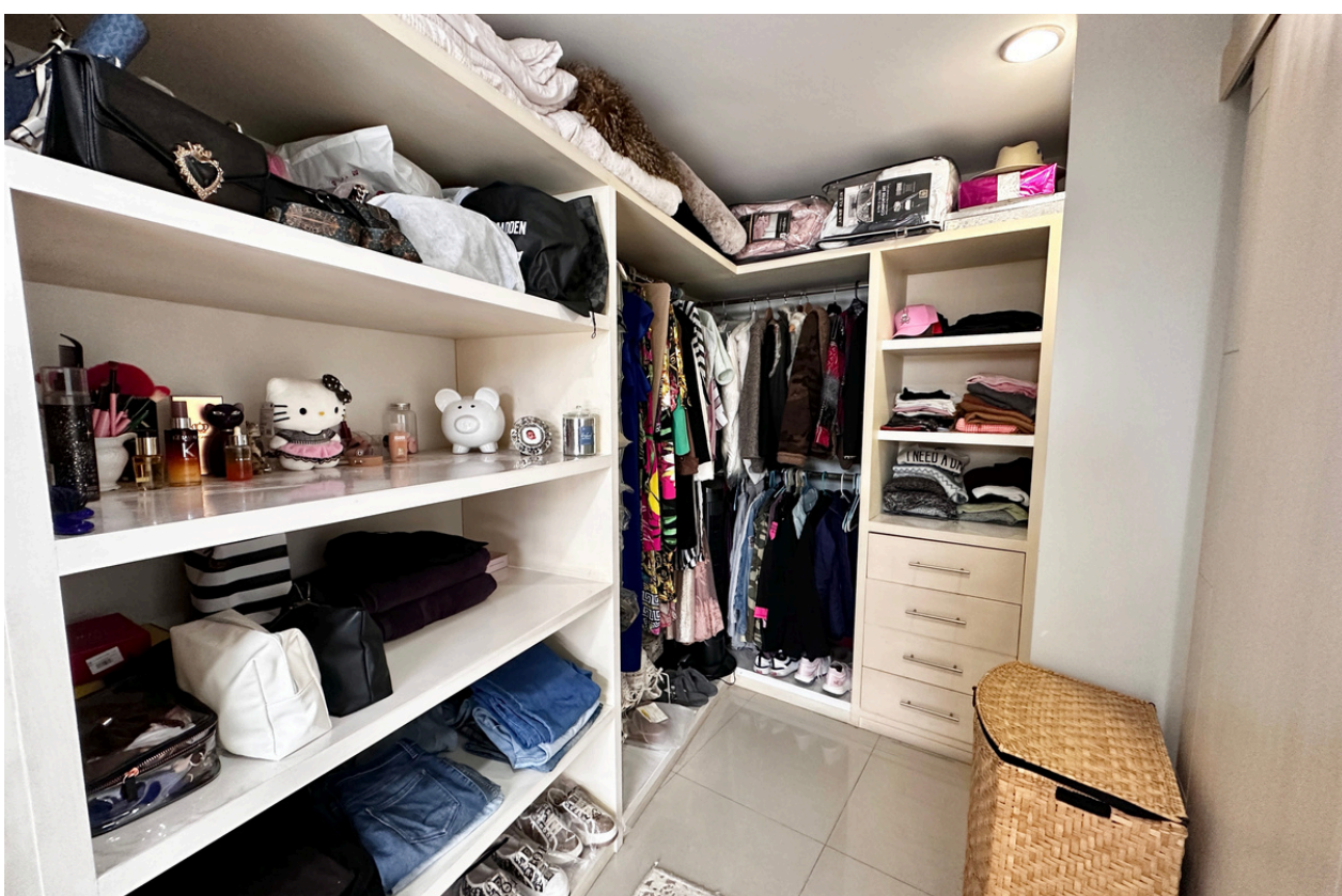
WALKING CLÓSET RECÁMARA 2