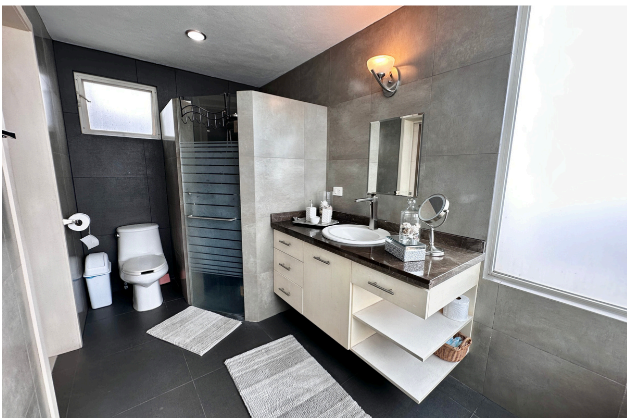
BAÑO COMPLETO RECÁMARA PRINCIPAL