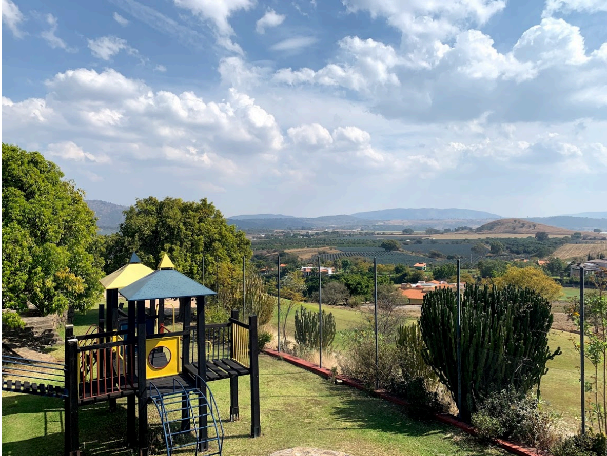
Área de juegos infantiles