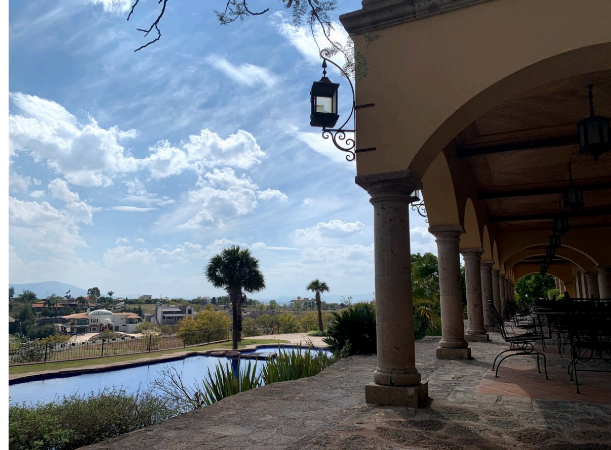
Vista panorámica desde la terrace de la casa club