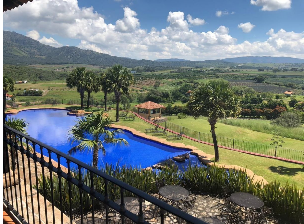
Vistas desde la Casa Club