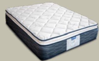
COLCHON MAVERICK Y ALMOHADAS BASIC ATLAS 2 PZAS