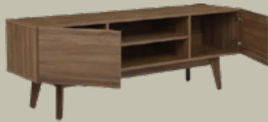
CREDENZA DE MADERA A BASE DE LISTON DE TZALAM 3 PZAS