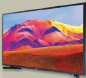
TV 65 PULGADAS 1 PZA