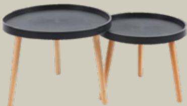
JUEGO DE MESAS DE CENTRO REDONDA DE MADERA LISTON DE TZALAM COMO BASE Y GRANITO CLARO EN LA PARTE SUPERIOR 2 PZAS