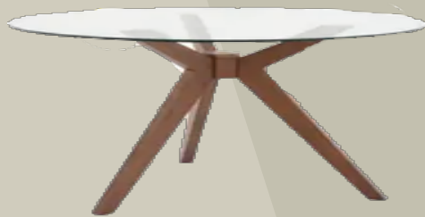
MESA CIRCULAR DE TZALAM VIDRIO TEMPLADO O MARMOL 1 PZAS