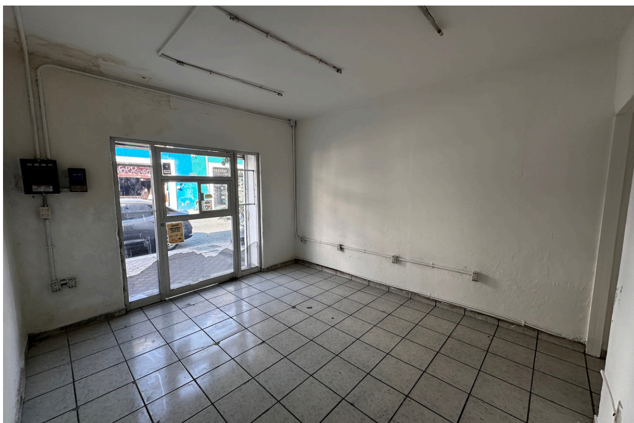
ÁREA DE VENTA