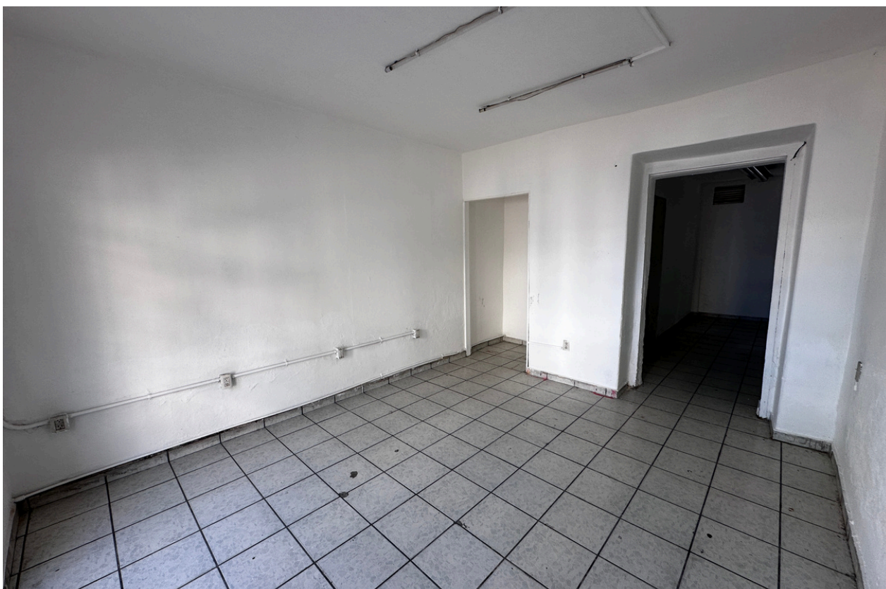
ÁREA DE VENTA