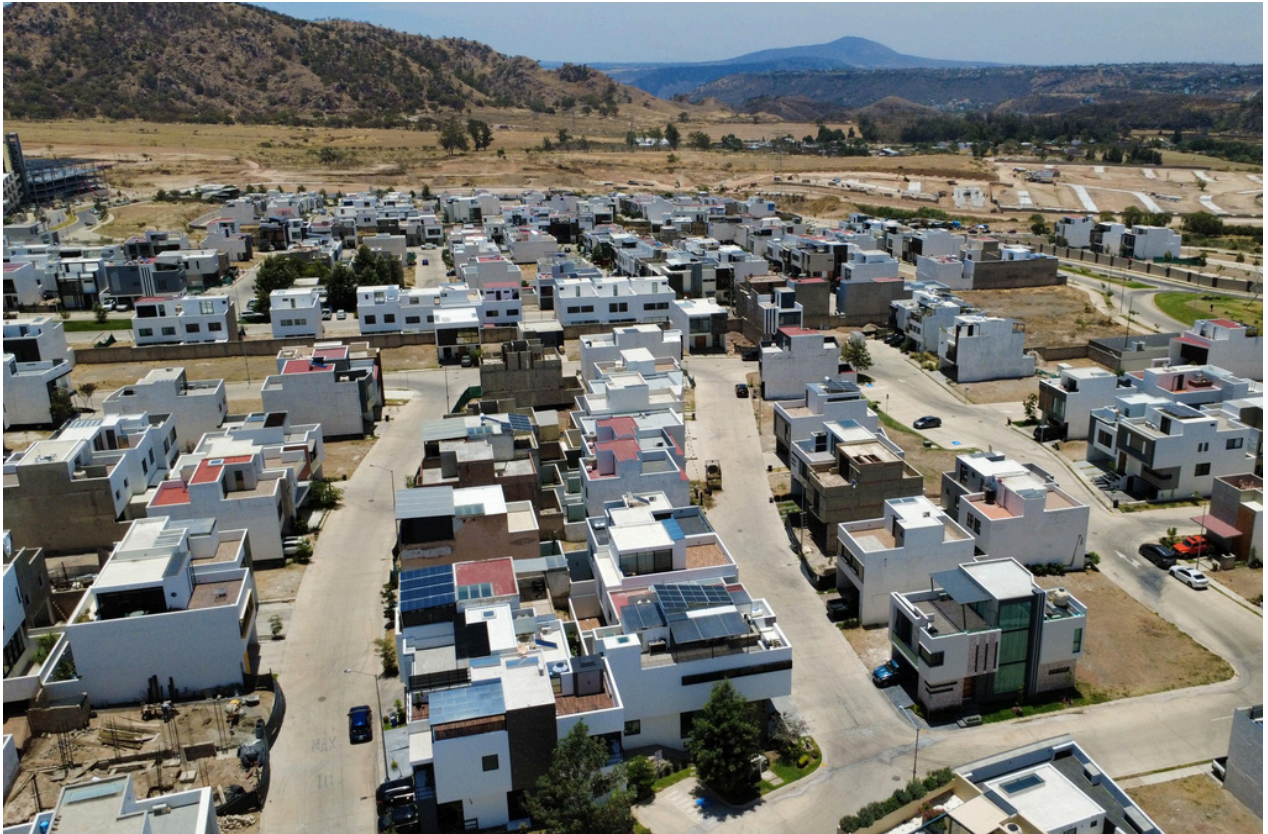
VISTA AÉREA DE COTO