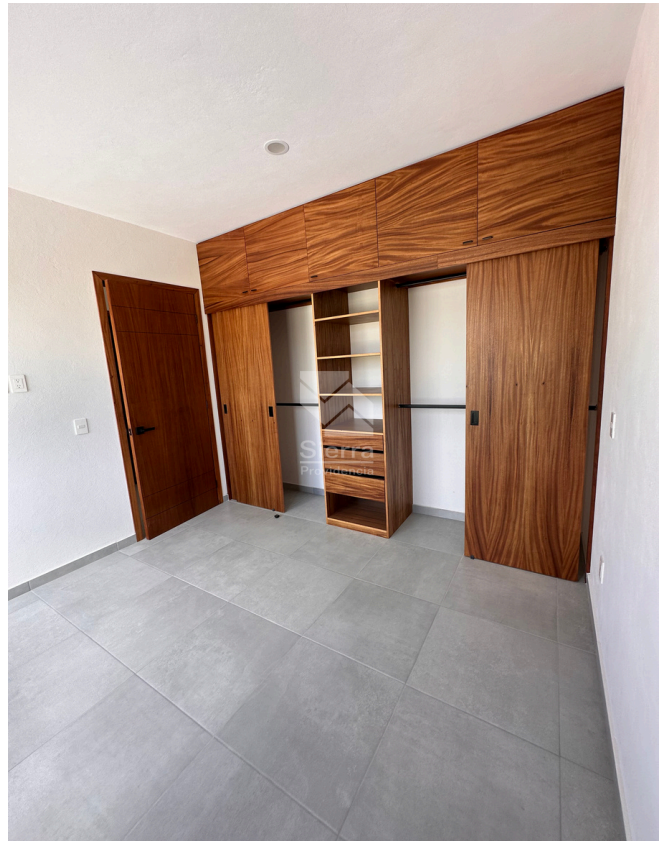
RECÁMARA SECUNDARIA 1