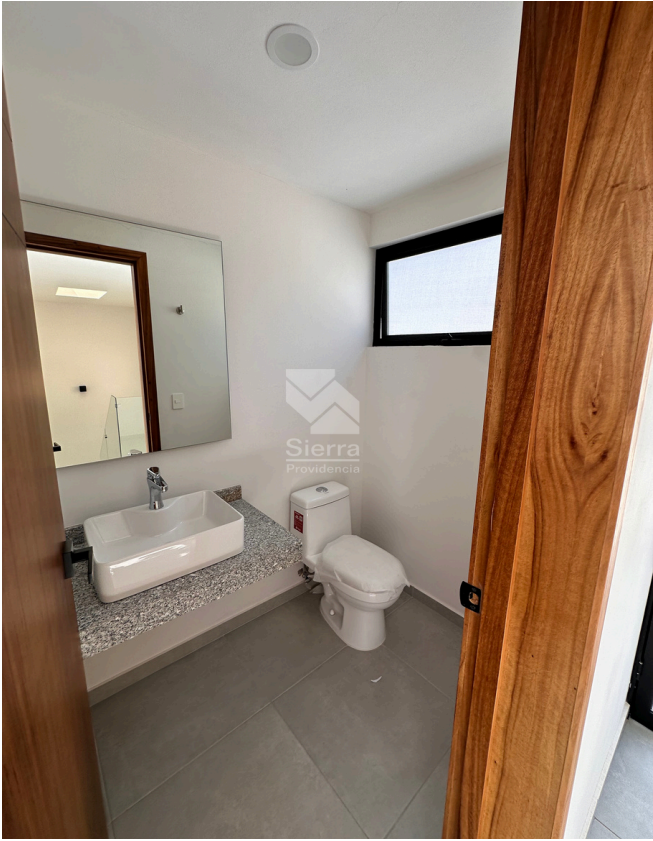
BAÑO ROOF TOP