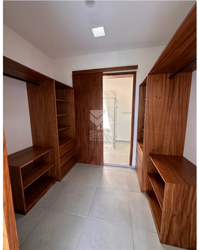
VESTIDOR RECÁMARA PRINCIPAL