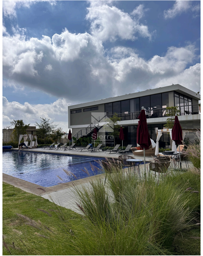
ALBERCA - CASA CLUB