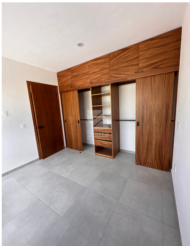
RECÁMARA SECUNDARIA 1