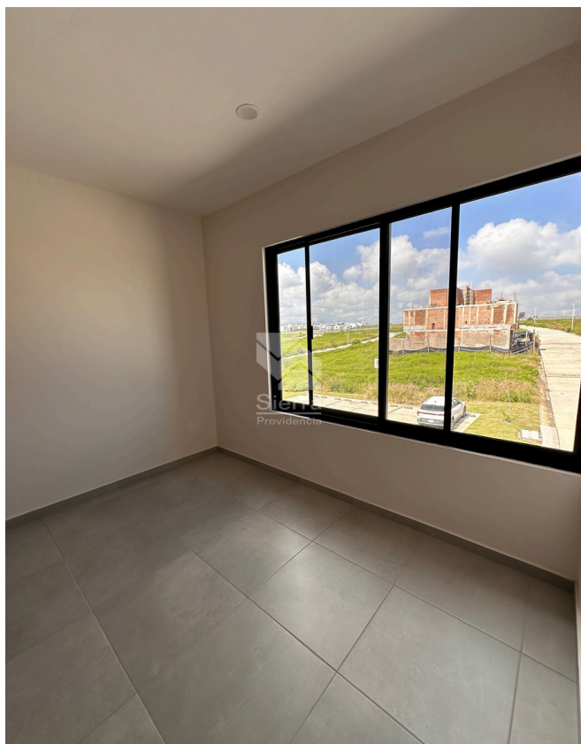
RECÁMARA SECUNDARIA 1