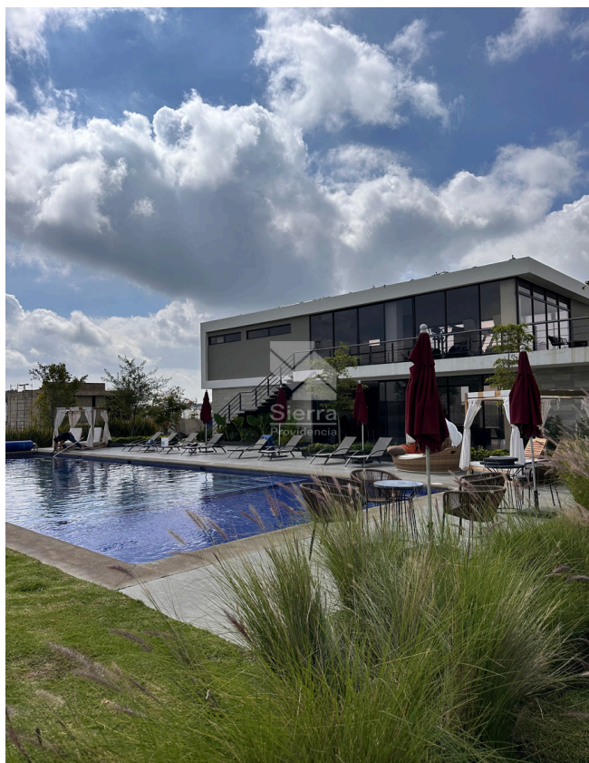
ALBERCA - CASA CLUB