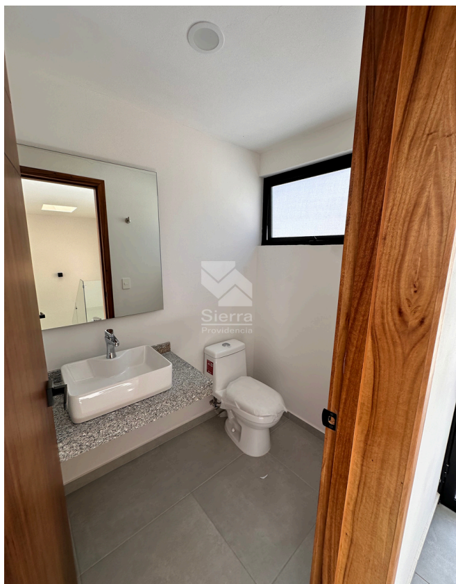
BAÑO ROOF TOP