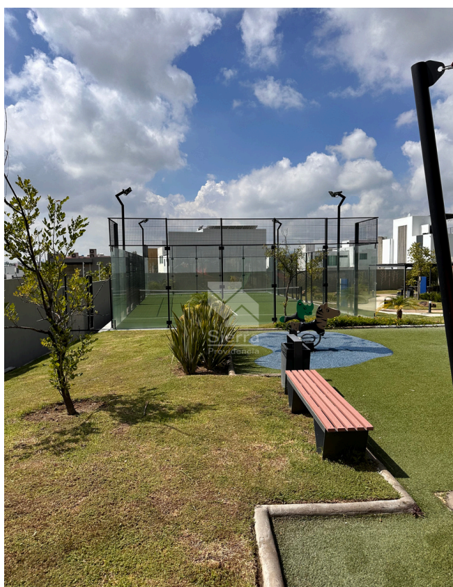
CANCHA DE PADEL