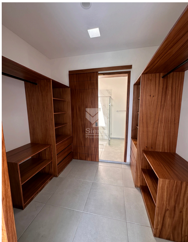
VESTIDOR RECÁMARA PRINCIPAL