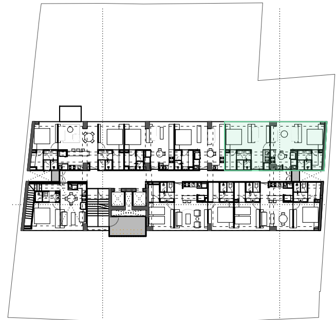
N | NIVEL 11 PLANTA DE UBICACIÓN