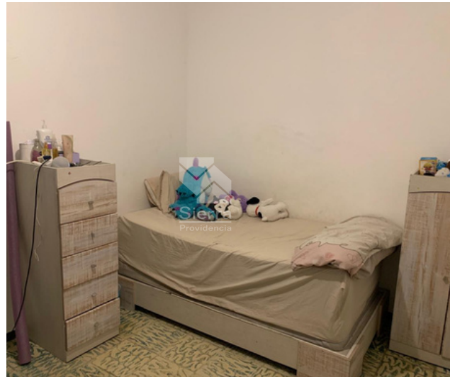
RECÁMARA SECUNDARIA 1