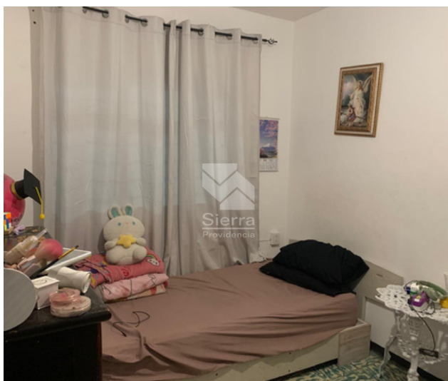
RECÁMARA SECUNDARIA 2