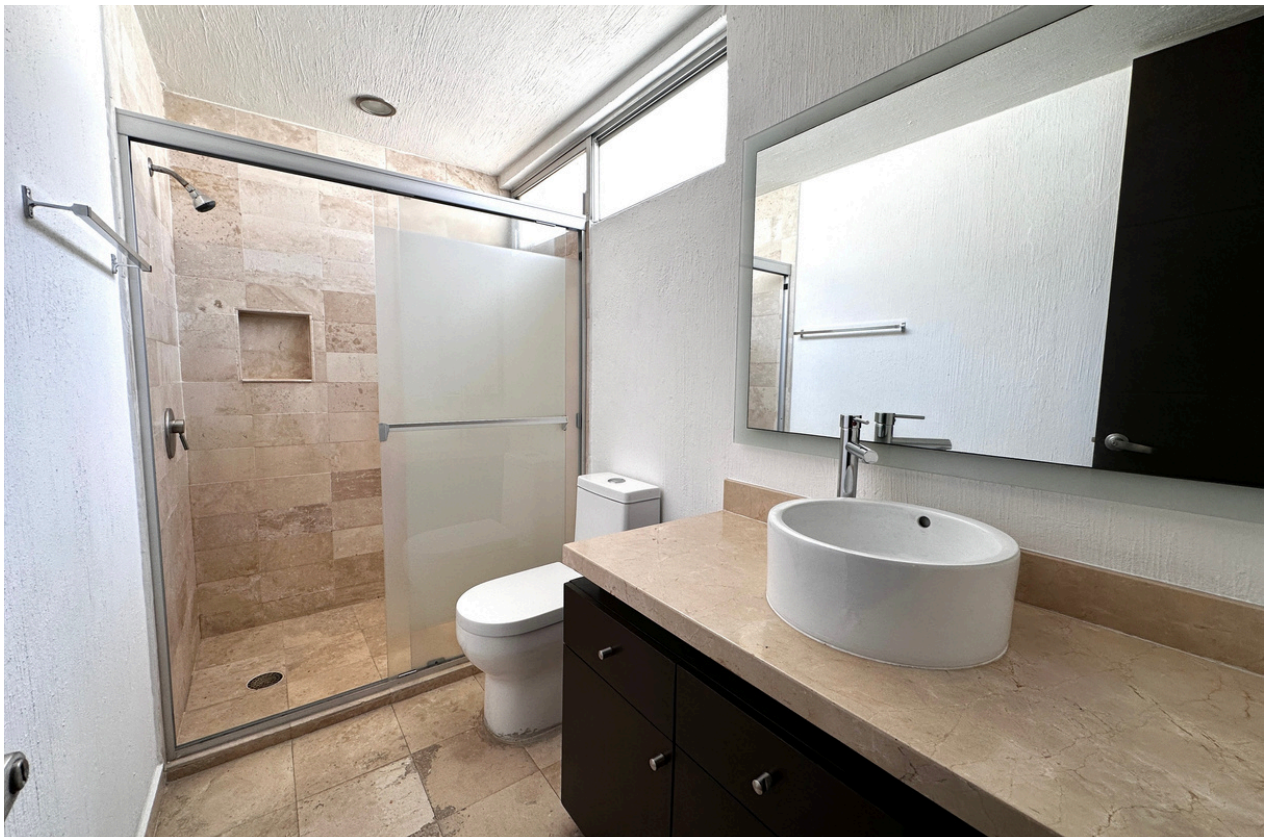
BAÑO RECÁMARA PRINCIPAL