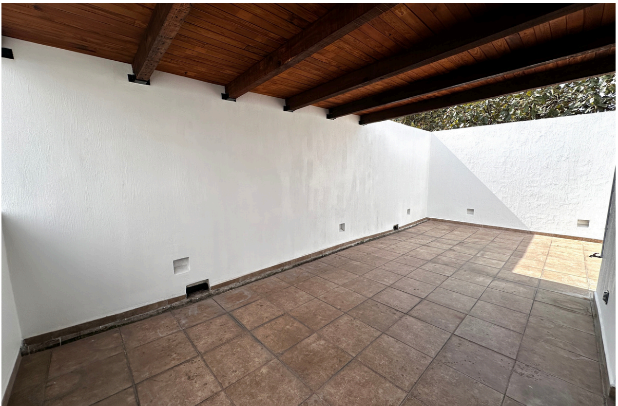
TERRAZA RECÁMARA PRINCIPAL