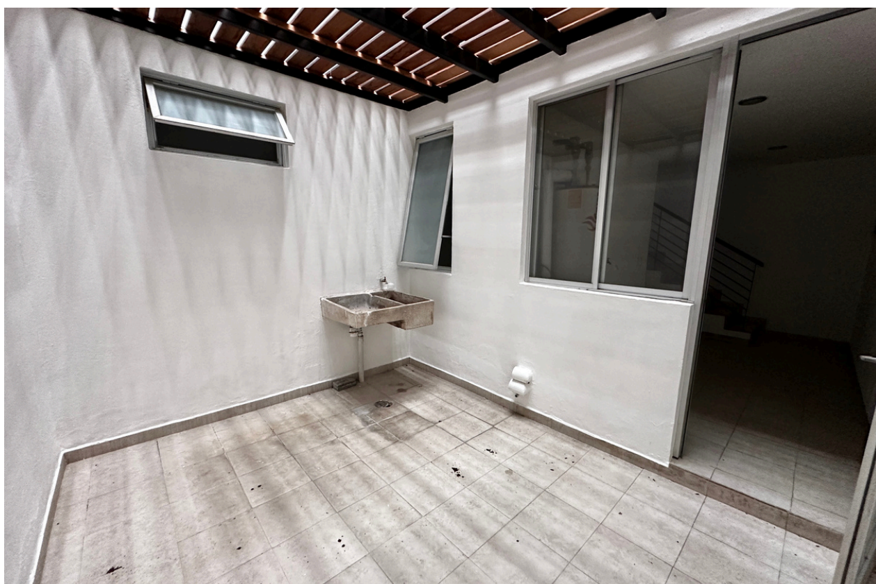
ÁREA DE LAVADO