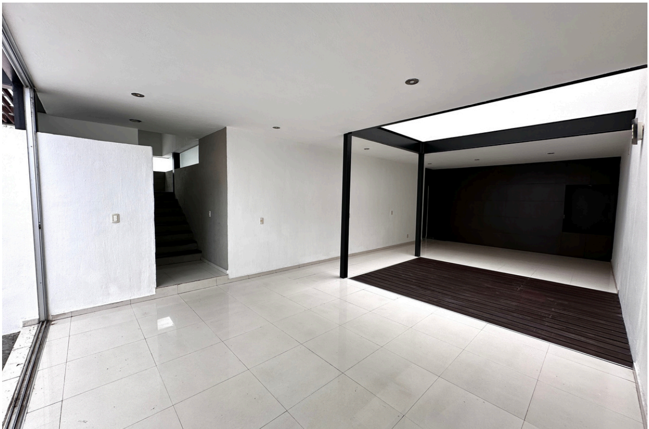
SALA - COMEDOR