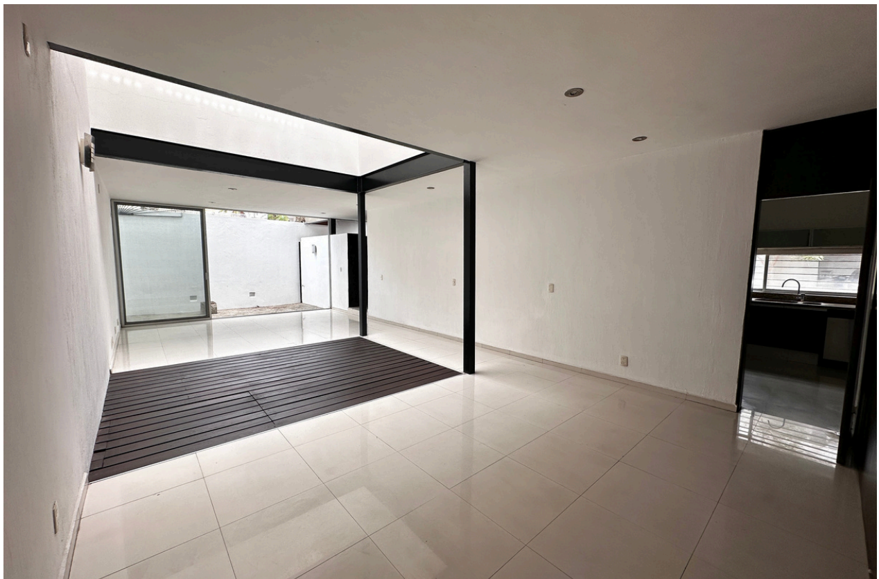
SALA - COMEDOR