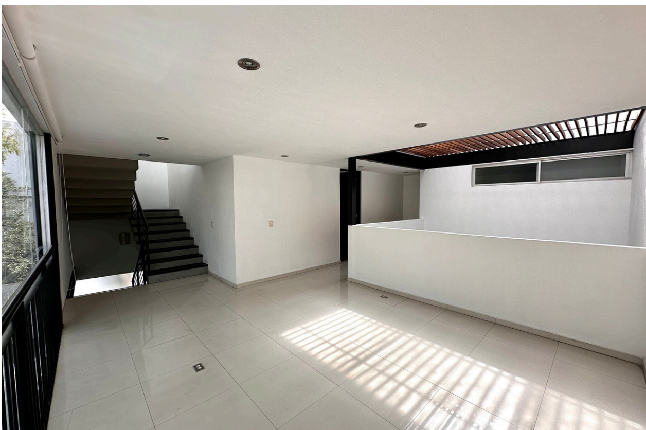
ESTAR DE TV