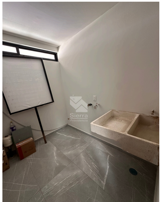
ÁREA DE LAVADO