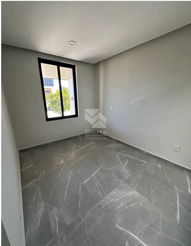
RECÁMARA SECUNDARIA / ESTUDIO