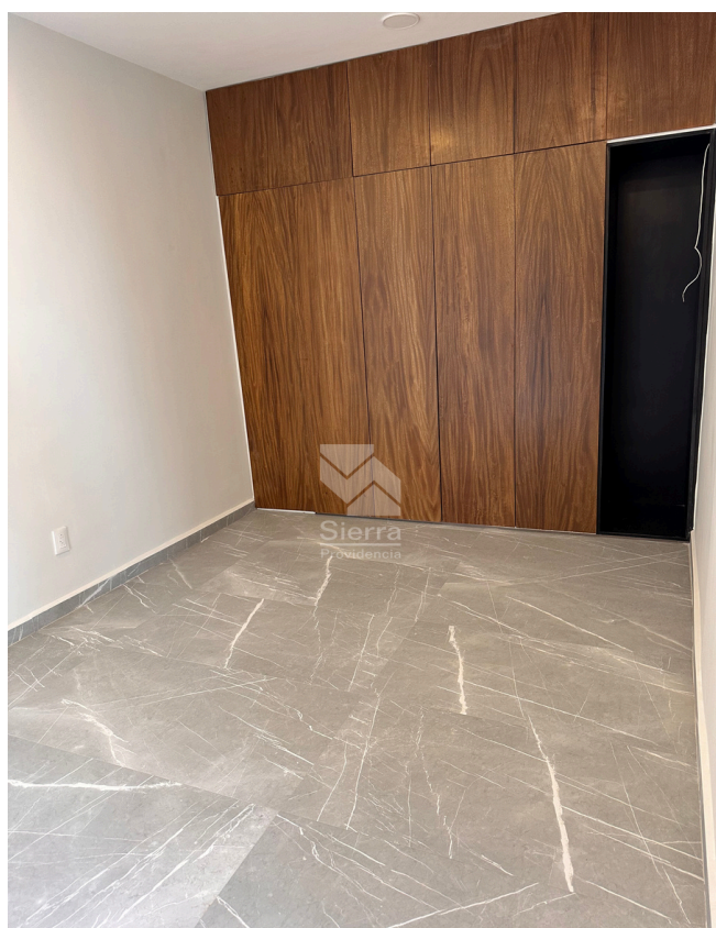
RECÁMARA SECUNDARIA 2