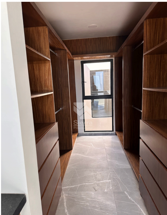
WALKING CLÓSET RECÁMARA PRINCIPAL