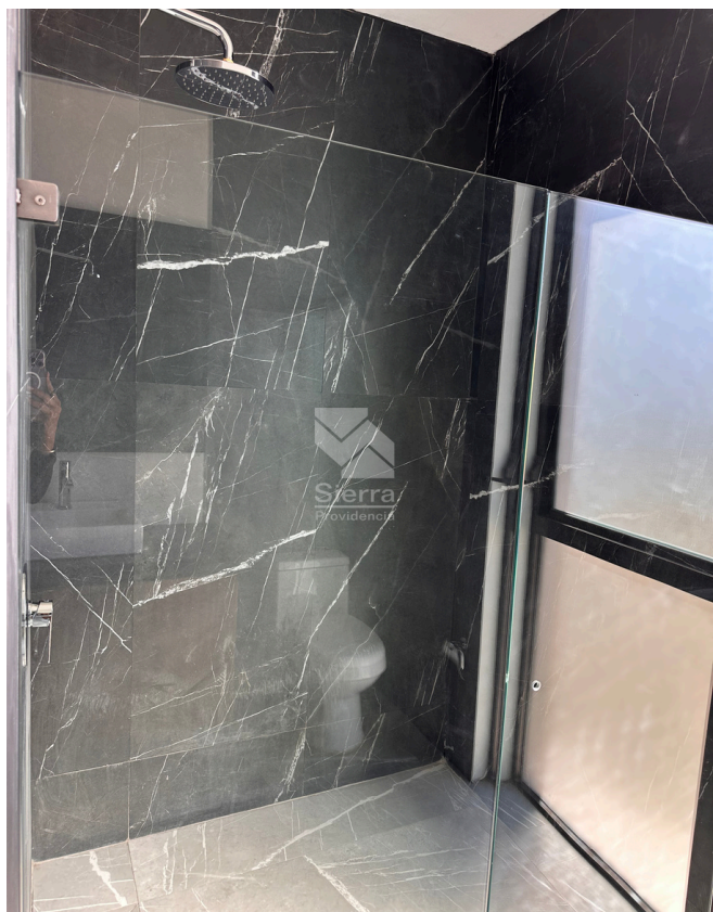
BAÑO RECÁMARA PRINCIPAL