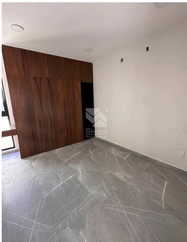
RECÁMARA SECUNDARIA 1