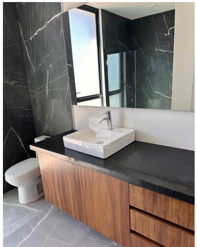
BAÑO RECÁMARA PRINCIPAL