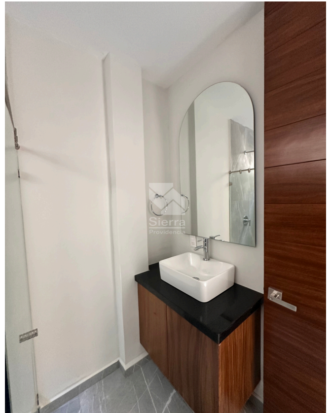
BAÑO COMPLETO P.B.