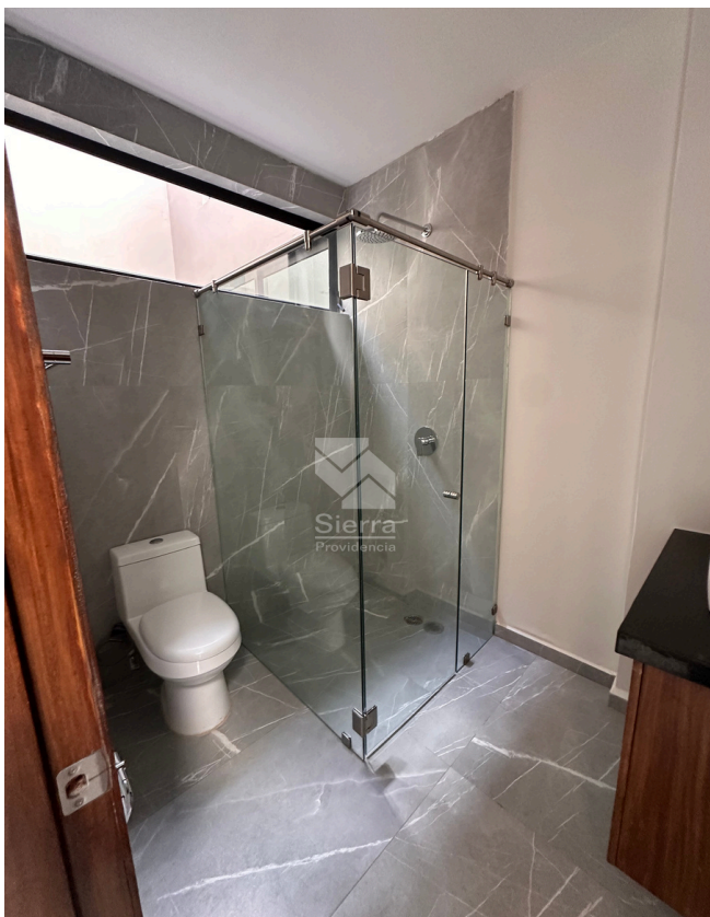
BAÑO COMPLETO P.B.