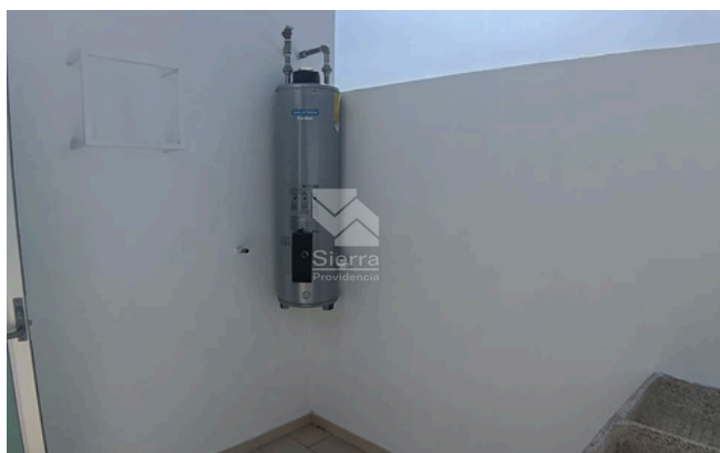
ÁREA DE LAVADO