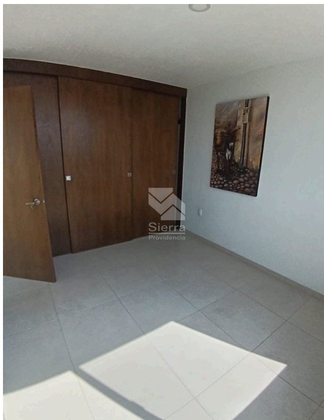
RECÁMARA SECUNDARIA 2