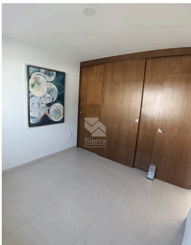
RECÁMARA SECUNDARIA 1