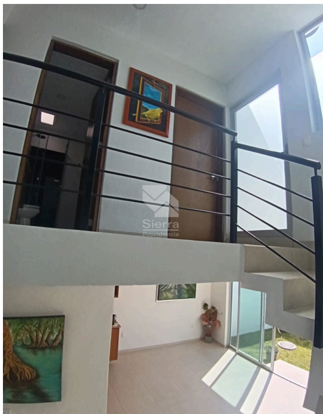
DISTRIBUCIÓN PLANTA ALTA