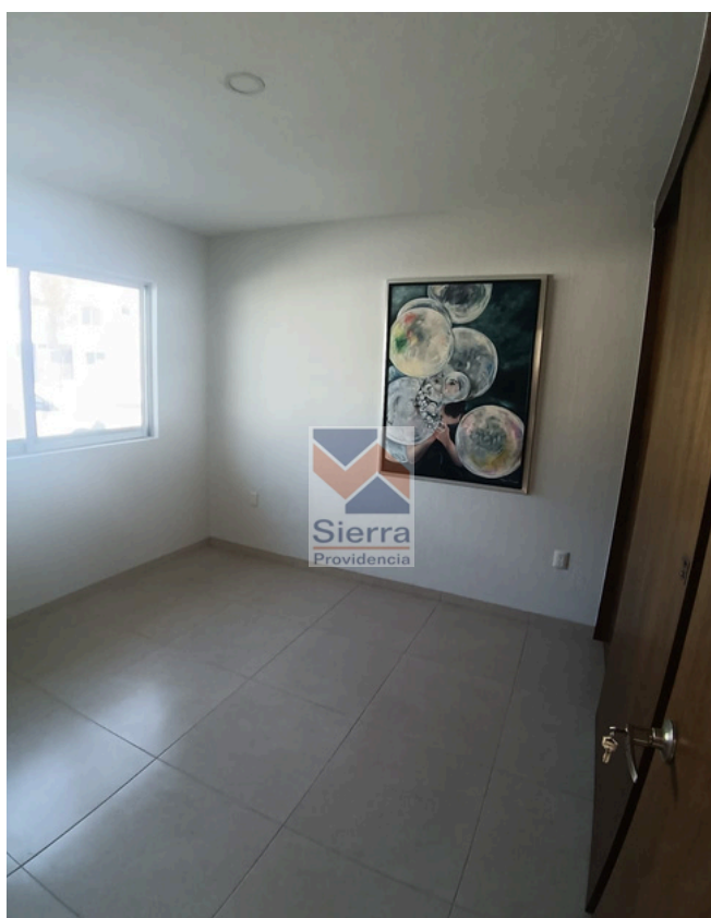
RECÁMARA SECUNDARIA 1