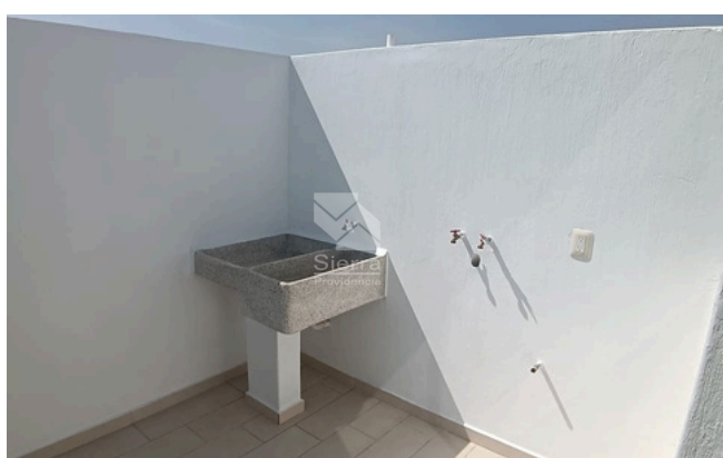
ÁREA DE LAVADO