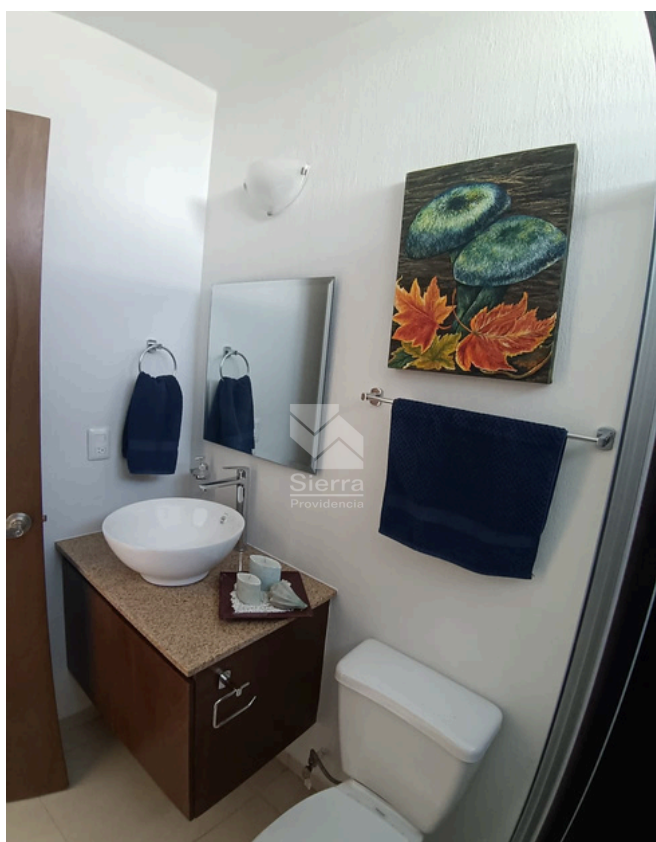
BAÑO COMPLETO P.B.