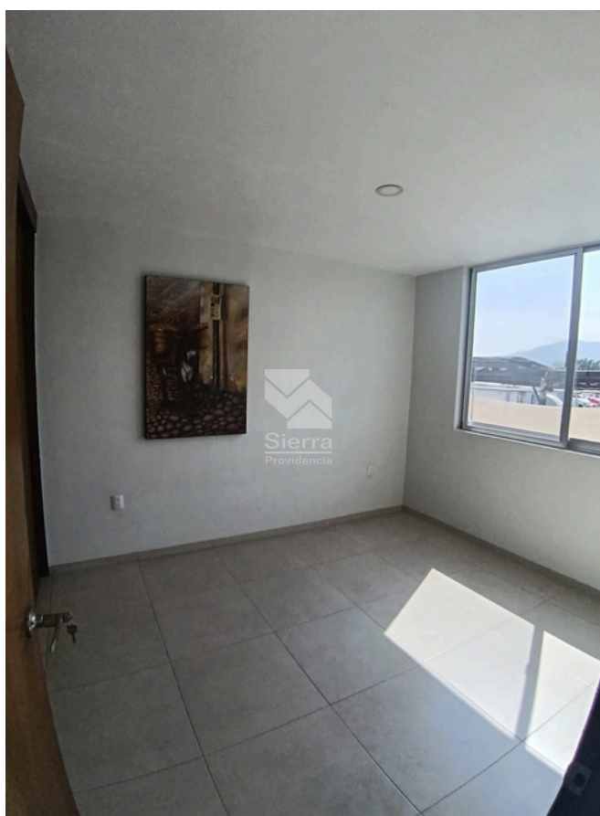
RECÁMARA SECUNDARIA 2