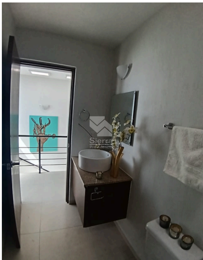
BAÑO RECÁMARA PRINCIPAL