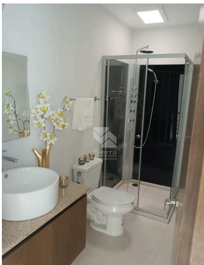
BAÑO RECÁMARA PRINCIPAL