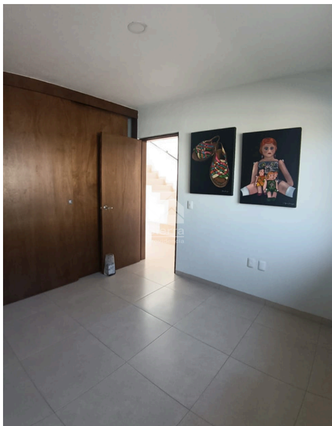
RECÁMARA SECUNDARIA 1