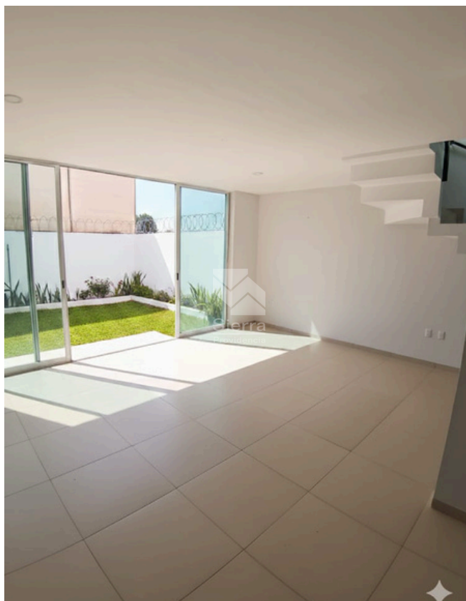
SALA - COMEDOR