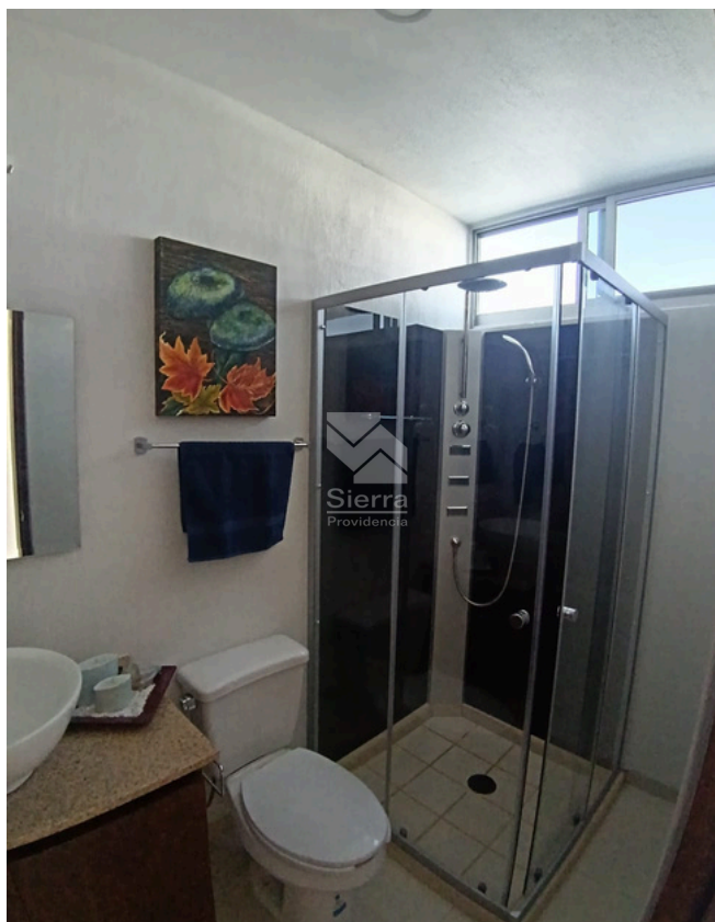
BAÑO COMPLETO P.B.