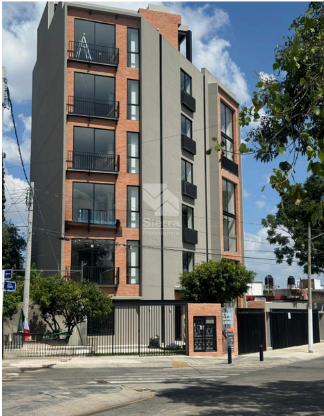
TORRE PUNTAL 01