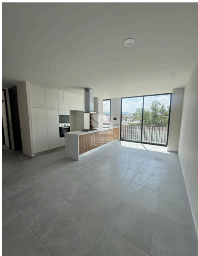
SALA - COMEDOR