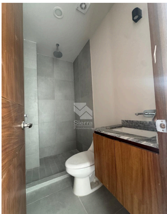
BAÑO RECÁMARA PRINCIPAL