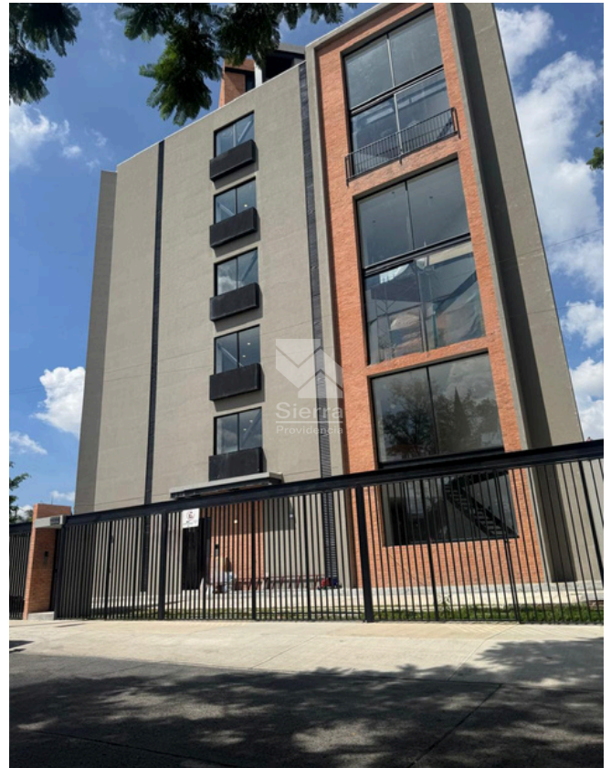
TORRE PUNTAL 01