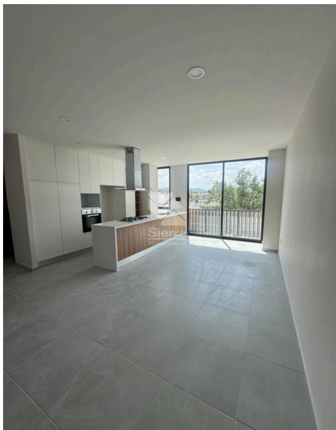
SALA - COMEDOR