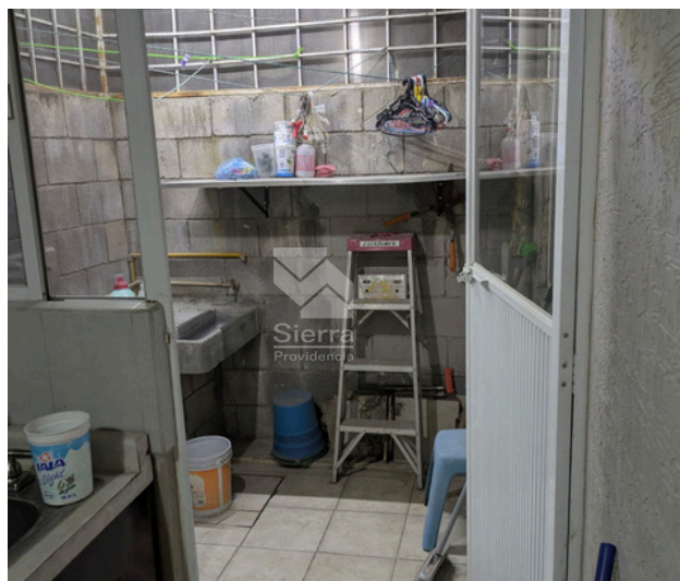
PATIO - ÁREA DE LAVADO