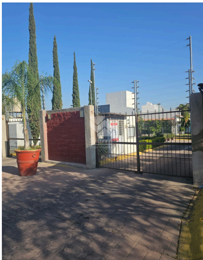
INGRESO A GRACCIONAMIENTO