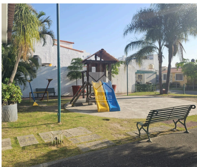
ÁREA DE JUEGOS INFANTILES