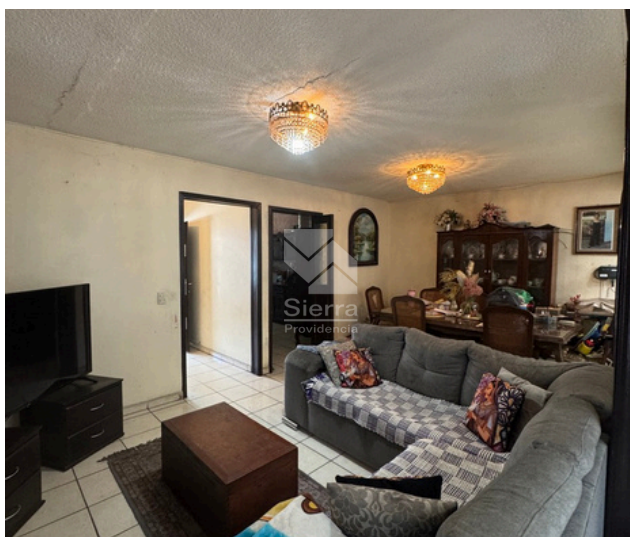
SALA - COMEDOR