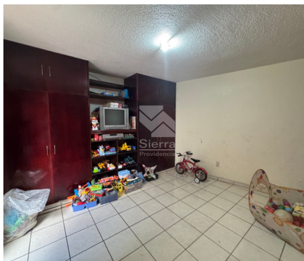
RECÁMARA SECUNDARIA P.B.