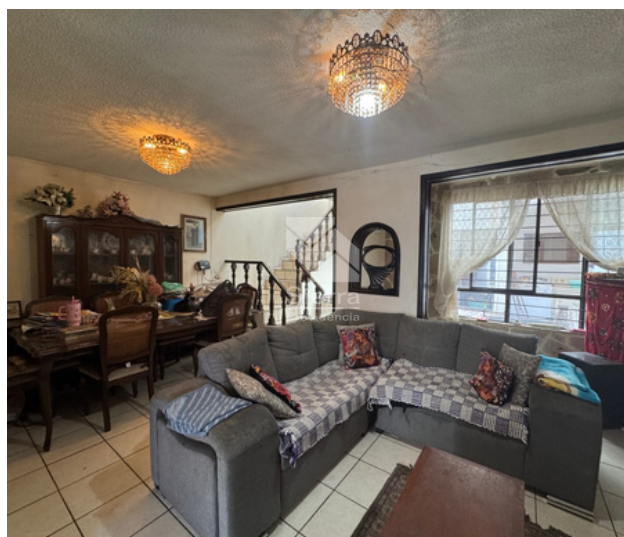
SALA - COMEDOR