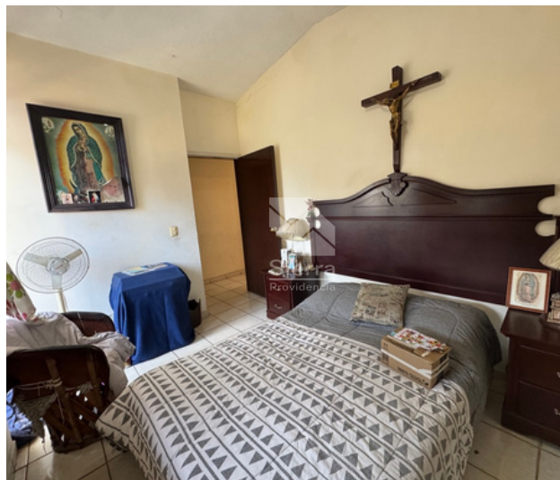
RECÁMARA SECUNDARIA 2