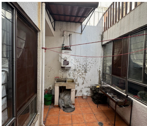
PATIO - ÁREA DE LAVADO