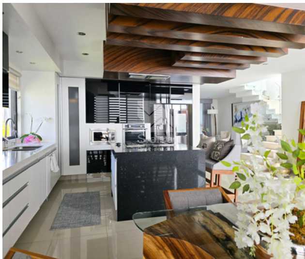
DISTRIBUCIÓN PLANTA BAJA