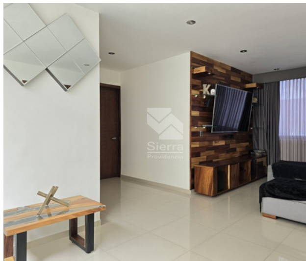
SALA DE TV