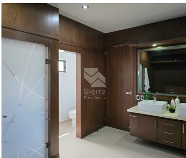
VESTIDOR Y BAÑO RECÁMARA PRINCIPAL