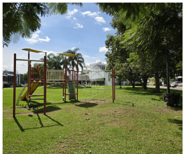
ÁREA DE JUEGOS INFANTILES