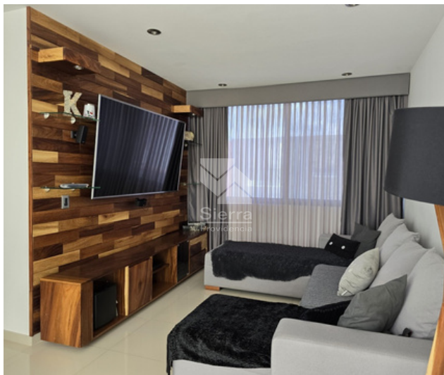
SALA DE TV