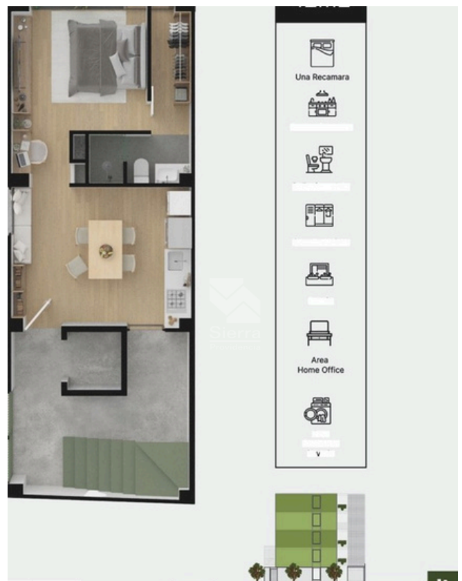
RENDER DISTRIBUCIÓN DEPARTAMENTO