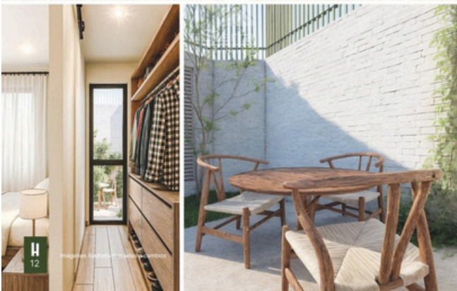
RENDER COCINA - VESTIDOR - BROCHURE