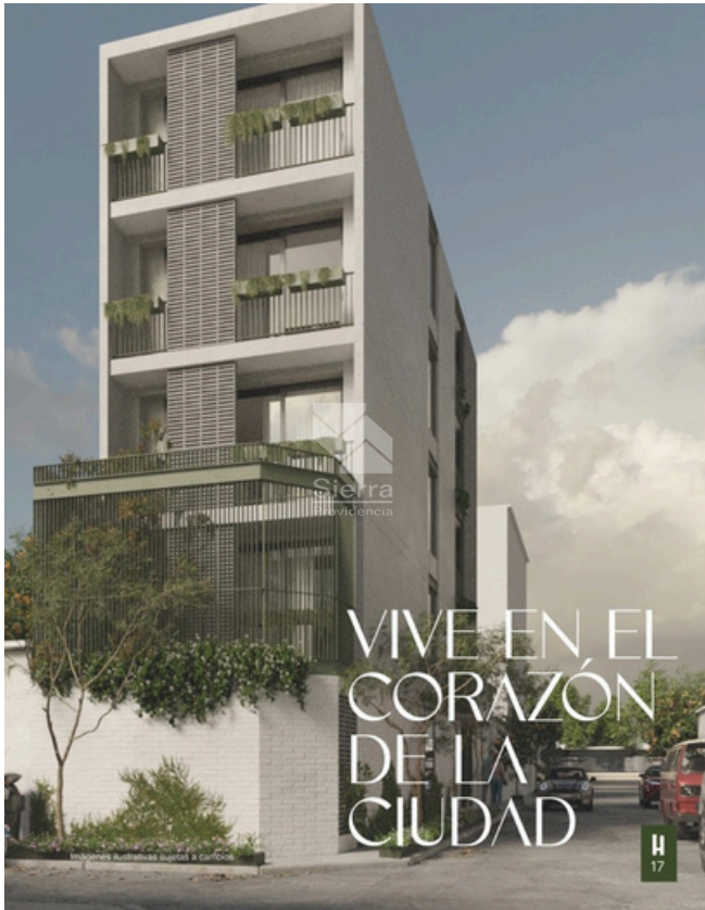
RENDER FACHADA DE EDIFICIO