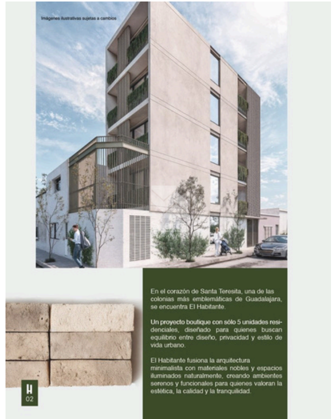
RENDER FACHADA DE EDIFICIO