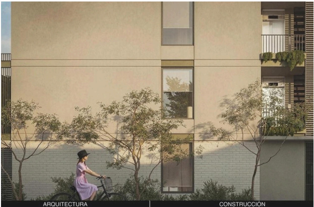
RENDER VISTA LATERAL DEL EDIFICIO