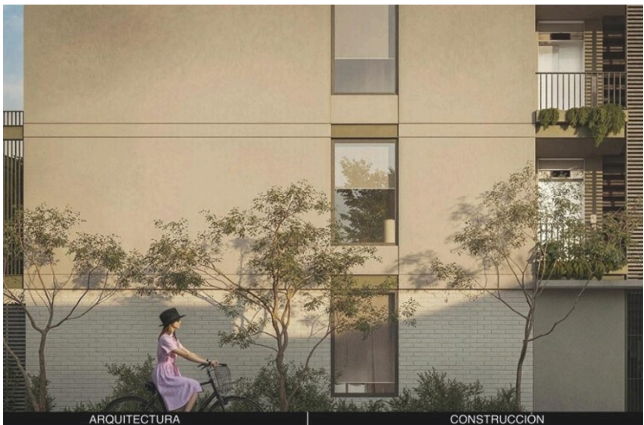
RENDER VISTA LATERAL DEL EDIFICIO