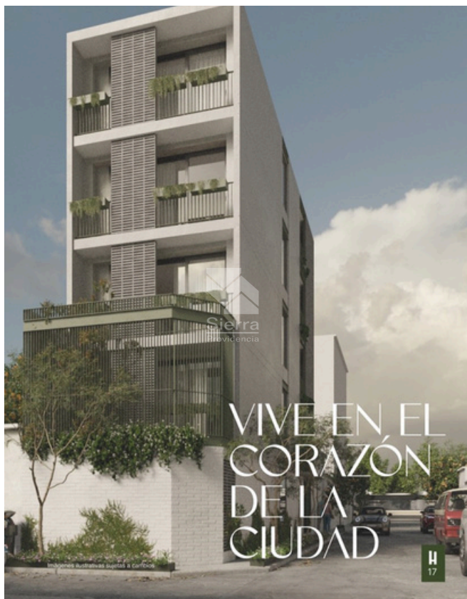
RENDER FACHADA DE EDIFICIO