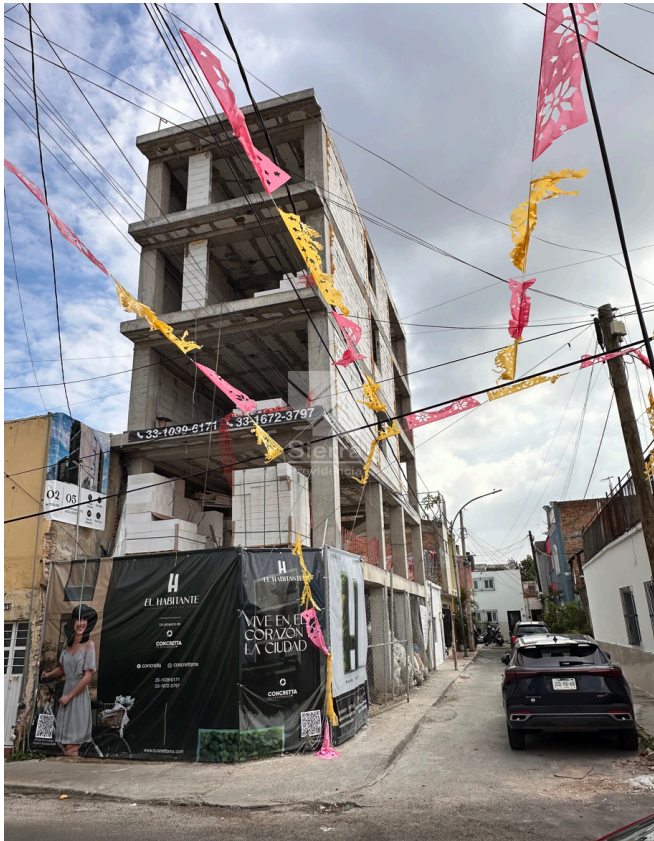
AVANCE DE OBRA EDIFICIO