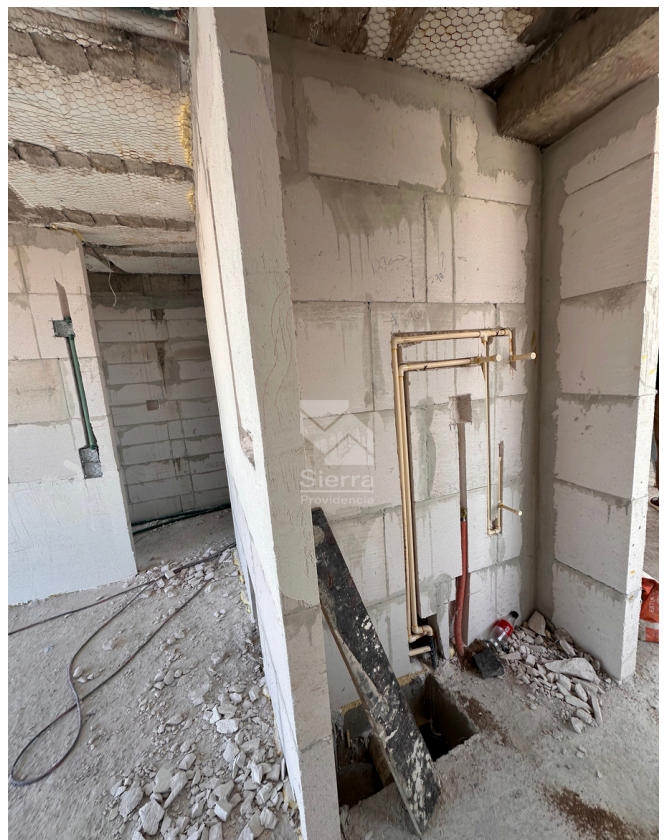
AVANCE DE OBRA PREPARACIÓN DE DUCTOS