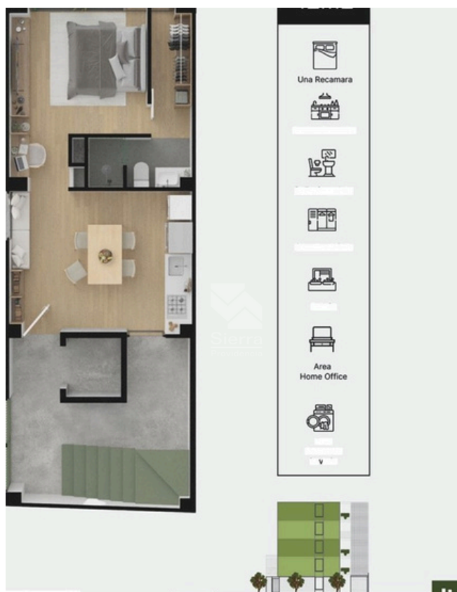
RENDER DISTRIBUCIÓN DEPARTAMENTO