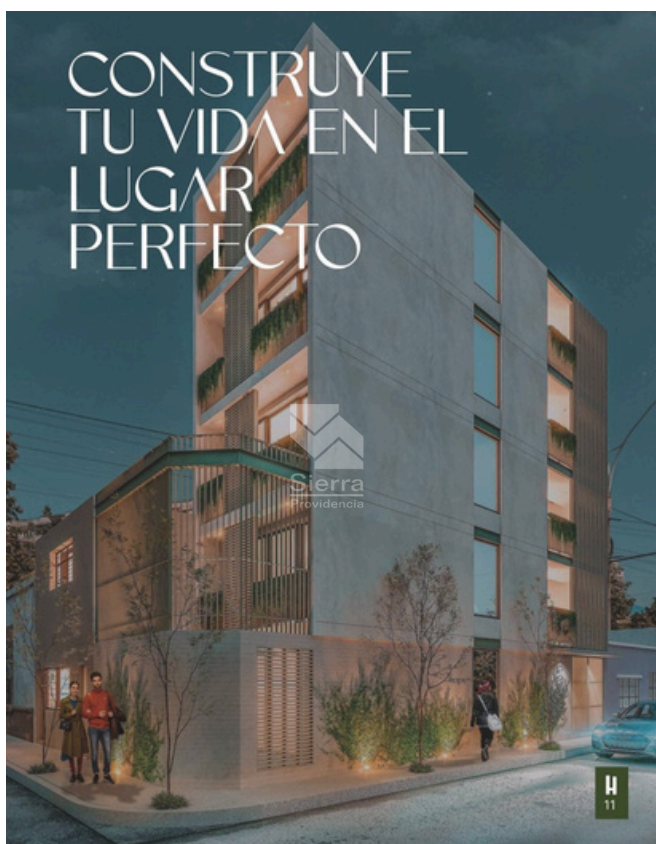
RENDER FACHADA DE EDIFICIO