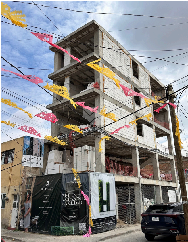
AVANCE DE OBRA EDIFICIO