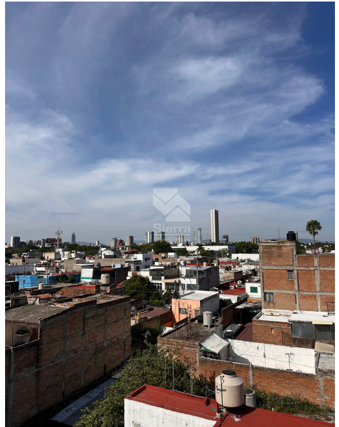
VISTA DEL EDIFICIO