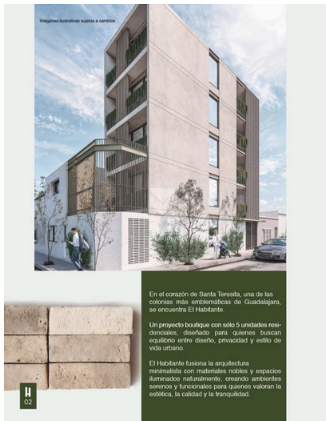
RENDER FACHADA DE EDIFICIO