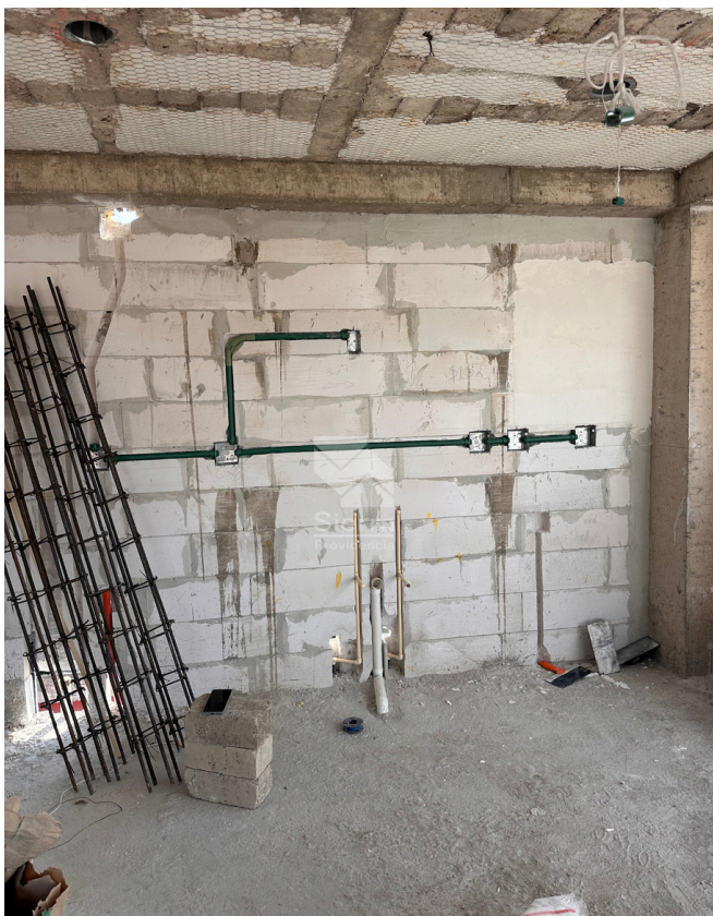
AVANCE DE OBRA COCINA