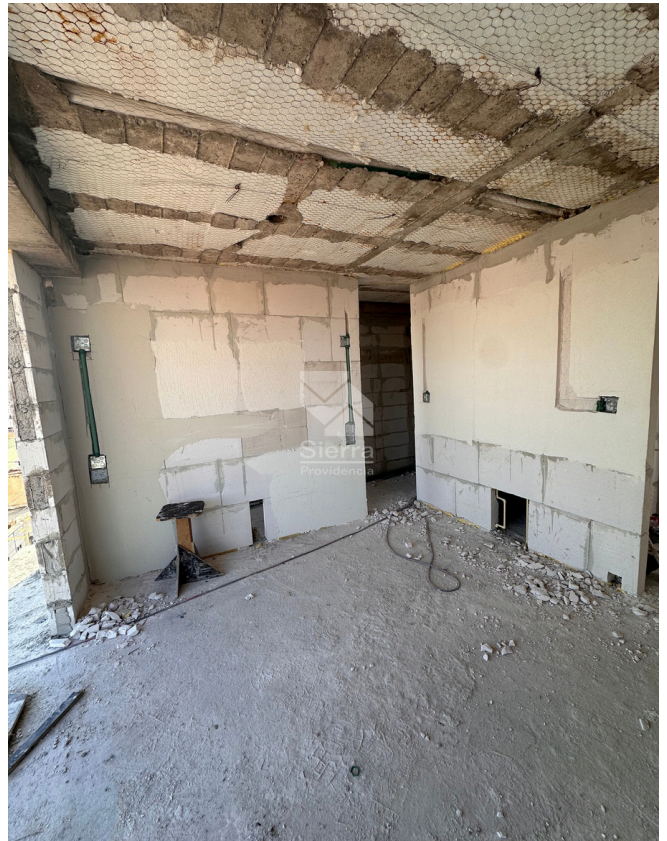
AVANCE DE OBRA RECÁMARA