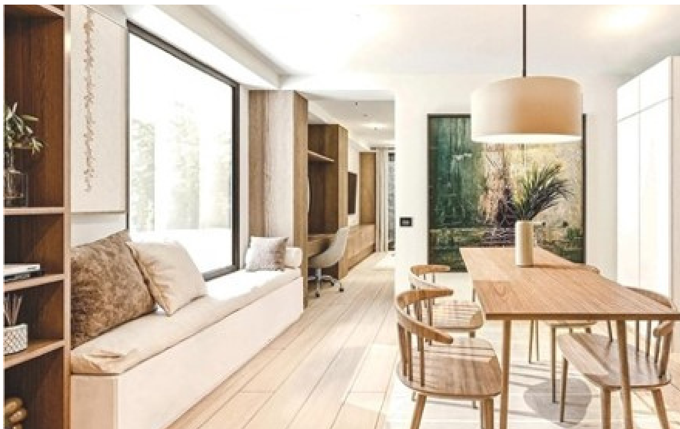
RENDER ÁREA SOCIAL