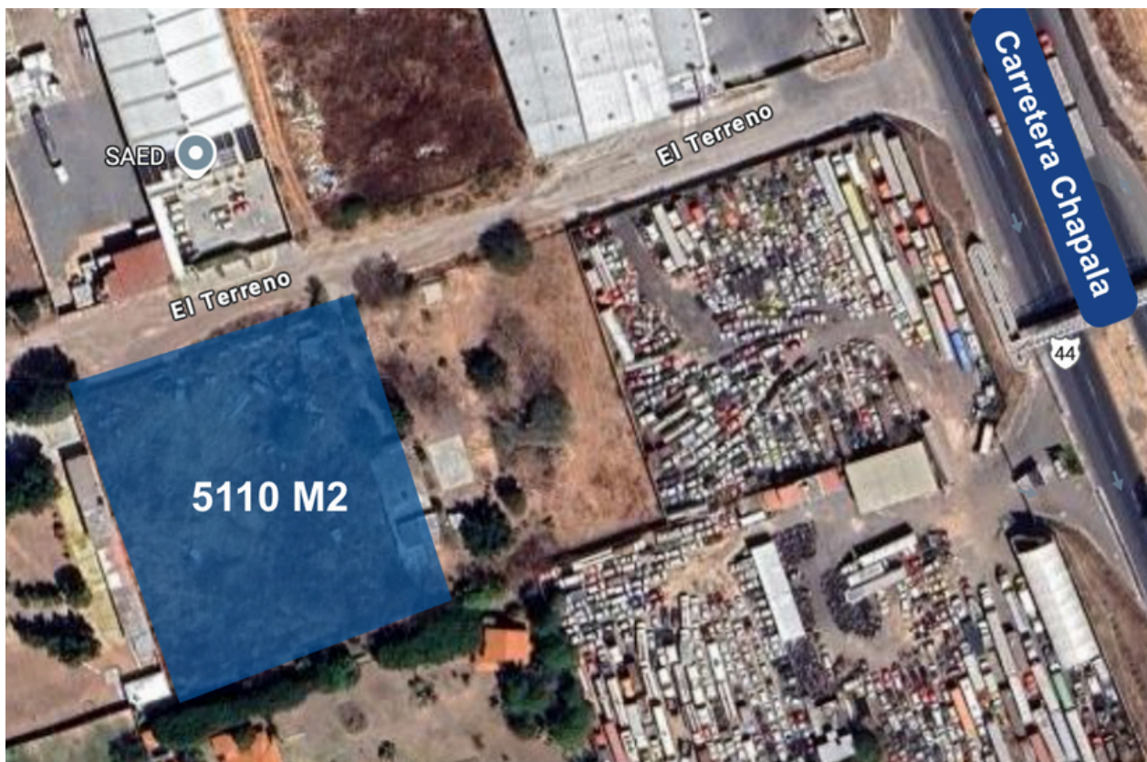
VISTA ÁEREA TERRENO