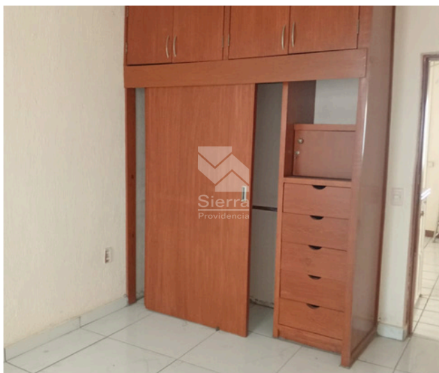
RECÁMARA SECUNDARIA 2