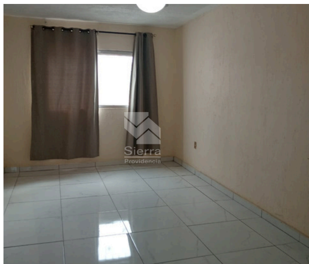
RECÁMARA SECUNDARIA 2