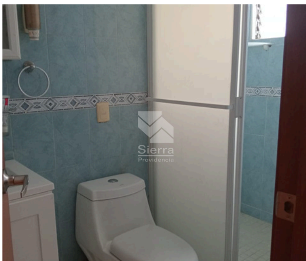
BAÑO RECÁMARA PRINCIPAL