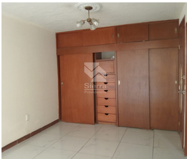
RECÁMARA SECUNDARIA 1