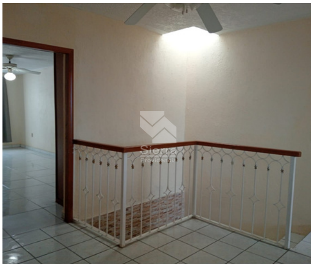
ESTAR DE TV