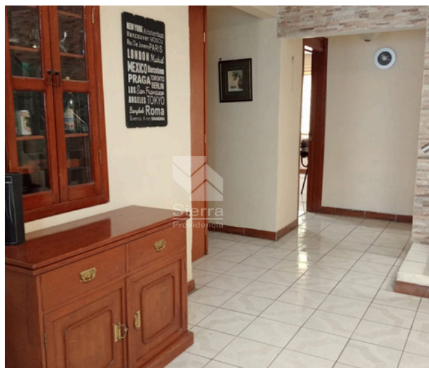
COMEDOR - SALA