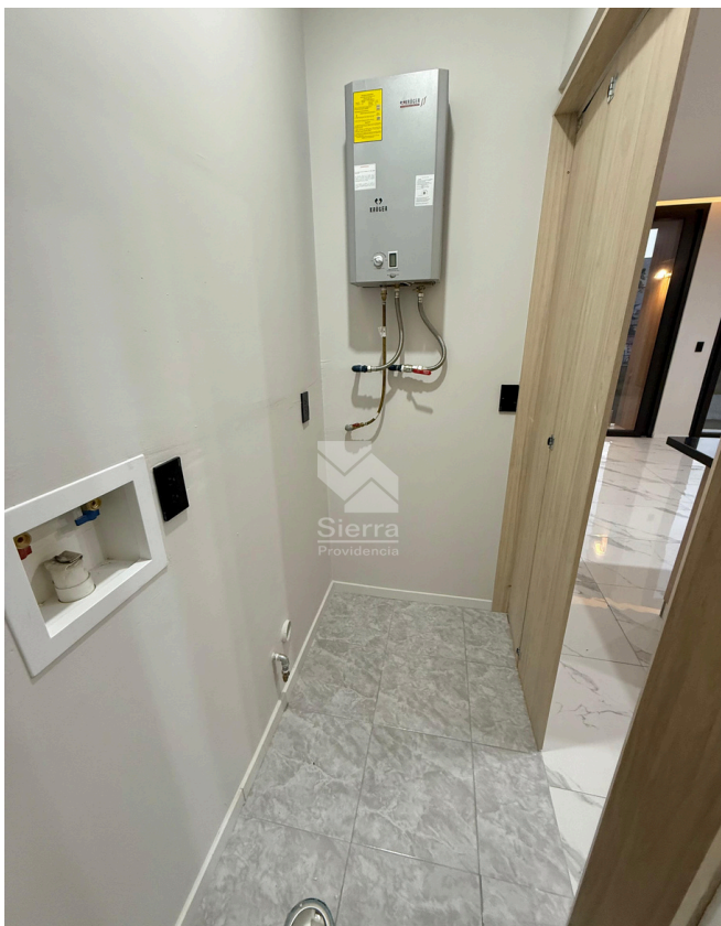
ÁREA DE LAVADO