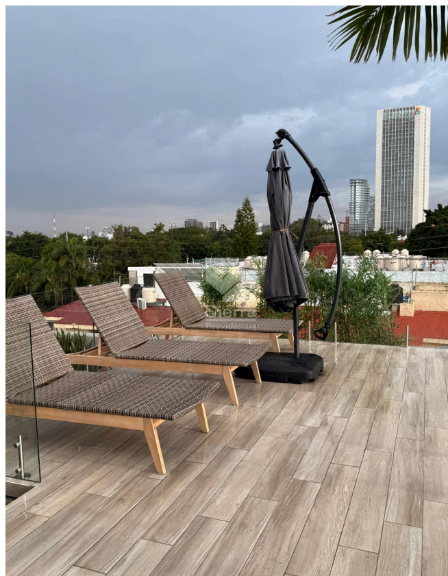
ÁREA DE ALBERCA