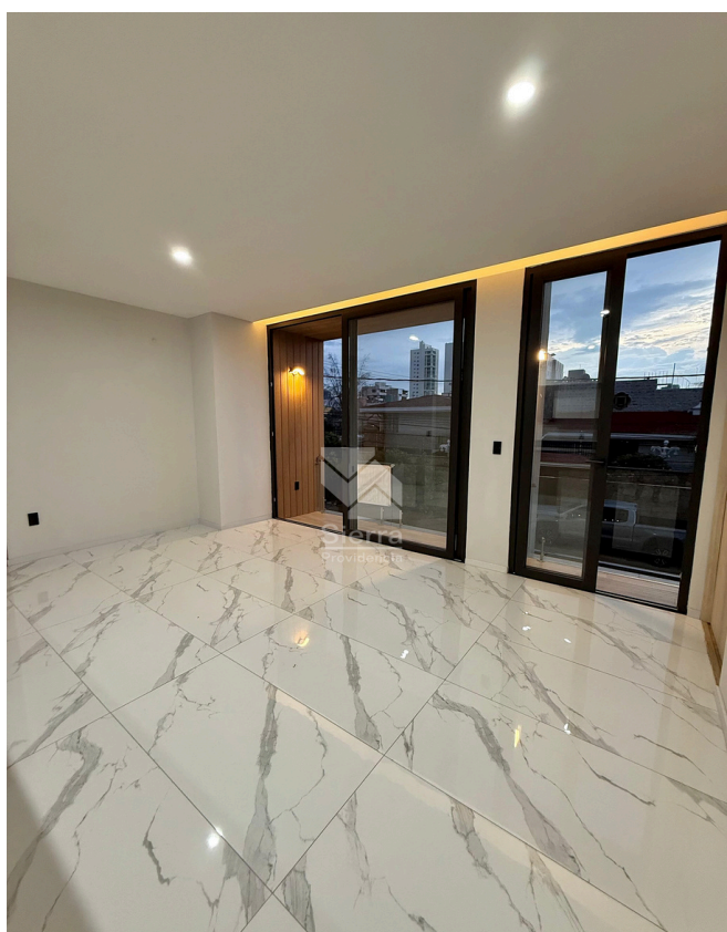
SALA - COMEDOR