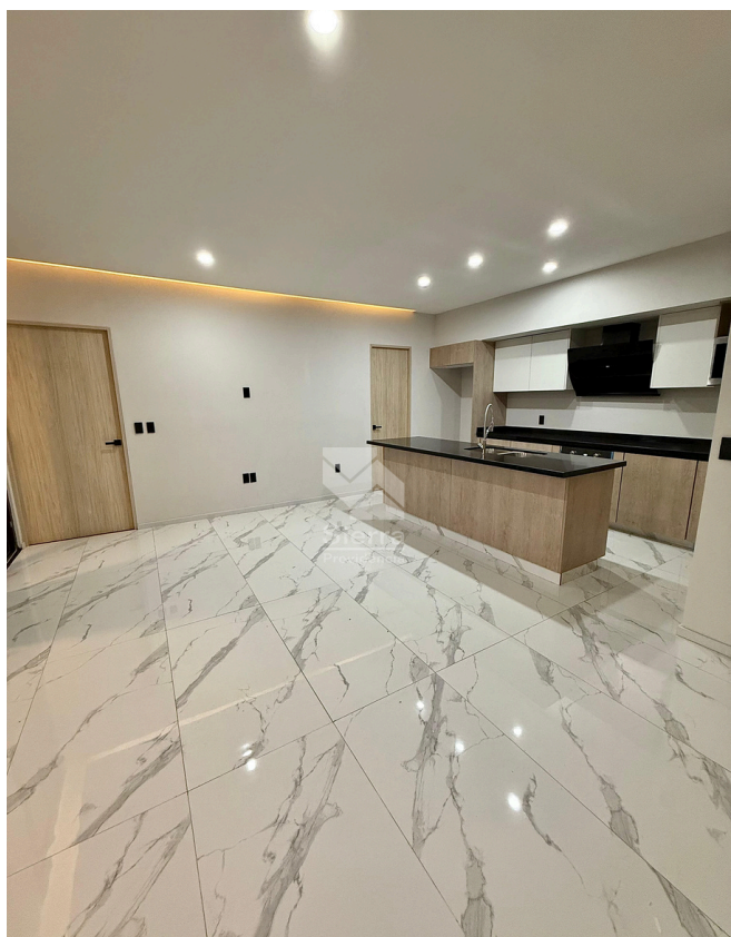
SALA - COMEDOR