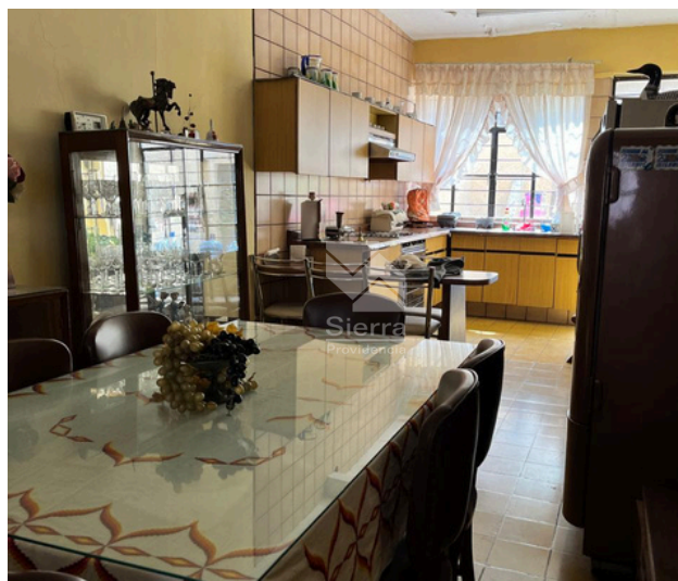
COMEDOR - COCINA