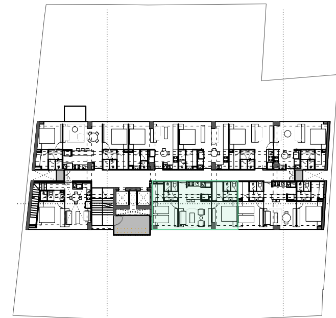
N n NIVEL 14 PLANTA DE UBICACIÓN