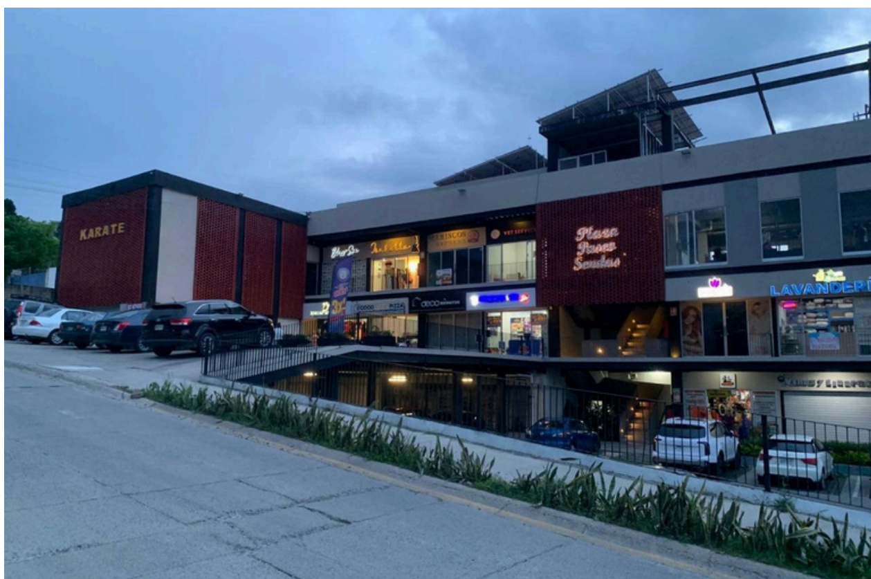
PLAZA PASEO SENDAS