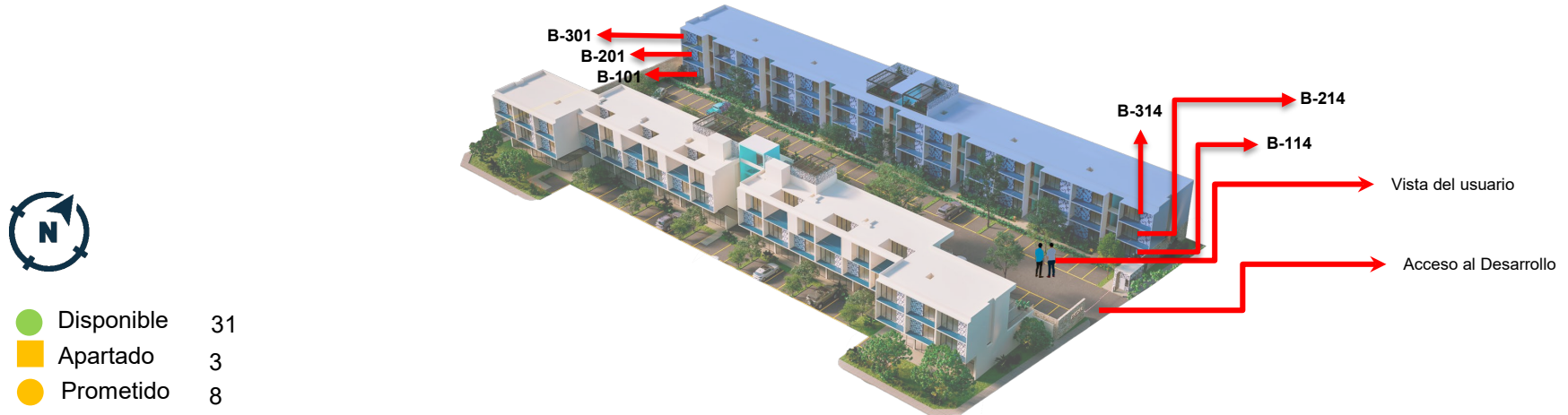
Vista Isométrico *El usuario está parado dentro del Estacionamiento