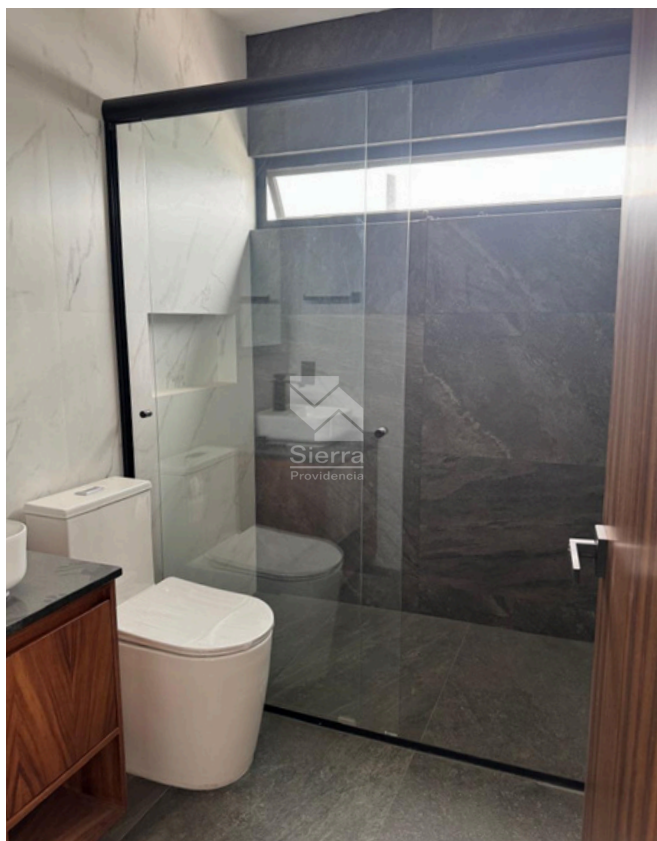
BAÑO RECÁMARA PRINCIPAL