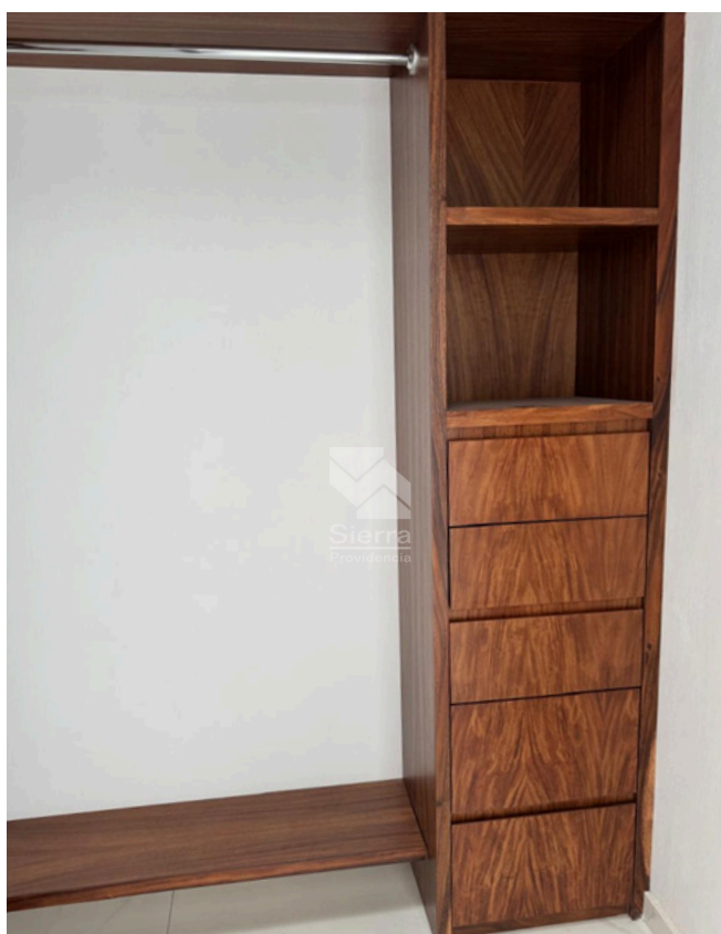
WALKING CLÓSET RECÁMARA PRINCIPAL