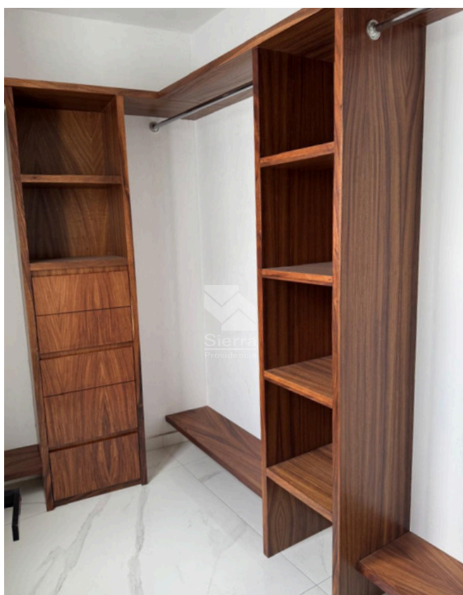
WALKING CLÓSET RECÁMARA SECUNDARIA