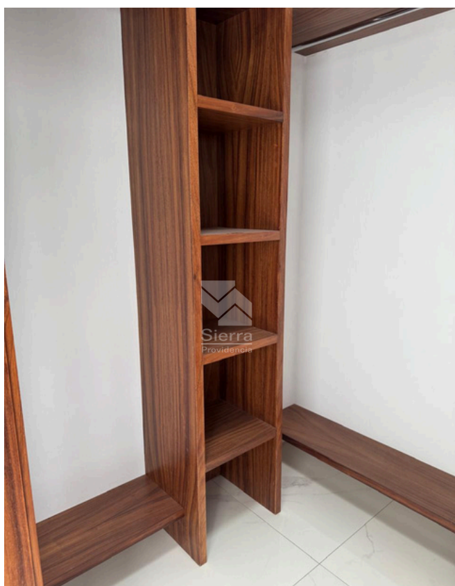
WALKING CLÓSET RECÁMARA PRINCIPAL