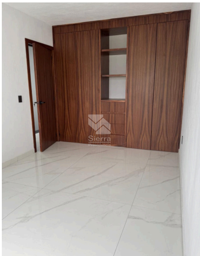
CLÓSET RECÁMARA SECUNDARIA