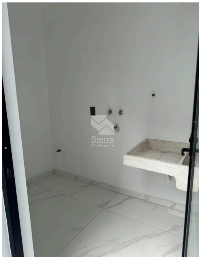
ÁREA DE LAVADO