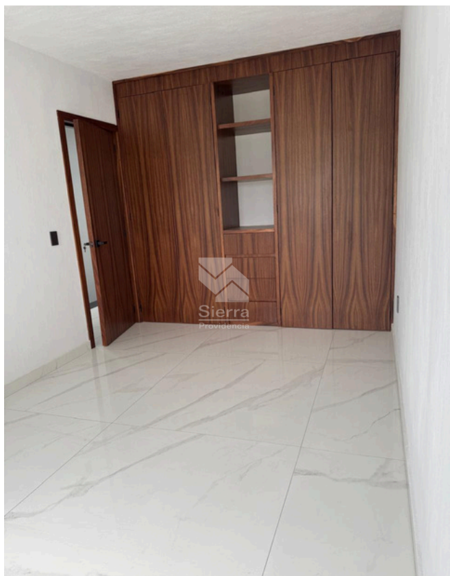
CLÓSET RECÁMARA SECUNDARIA