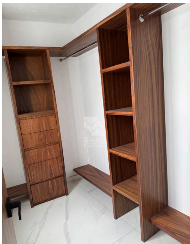
WALKING CLÓSET RECÁMARA SECUNDARIA