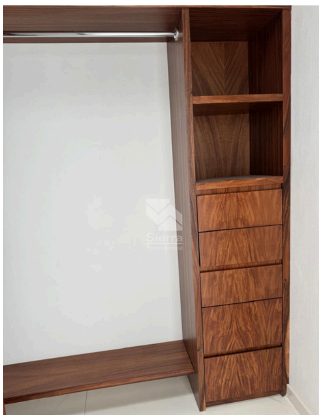
WALKING CLÓSET RECÁMARA PRINCIPAL