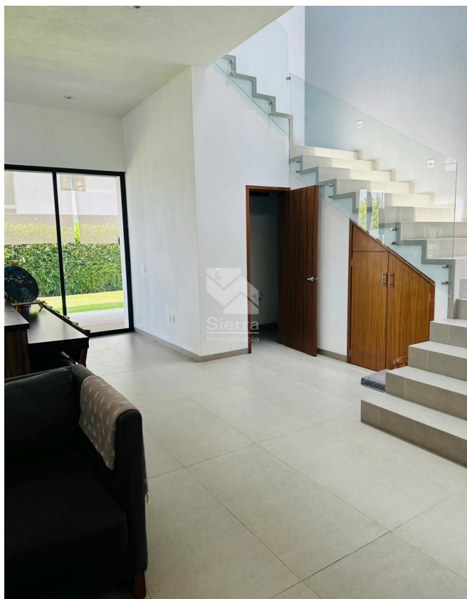
DISTRIBUCIÓN PLANTA BAJA