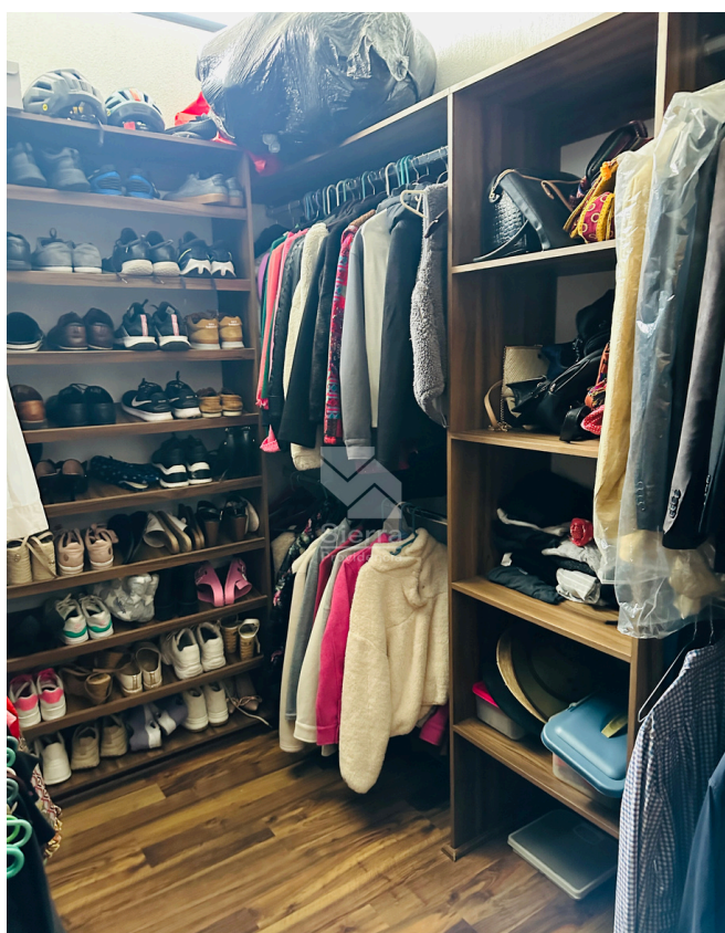
VESTIDOR RECÁMARA PRINCIPAL