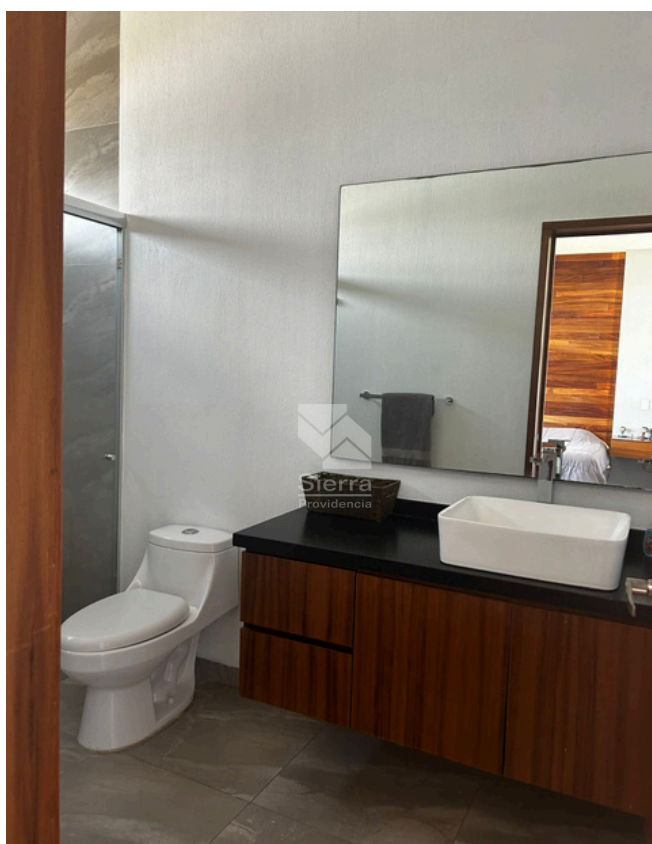
BAÑO RECÁMARA PRINCIPAL