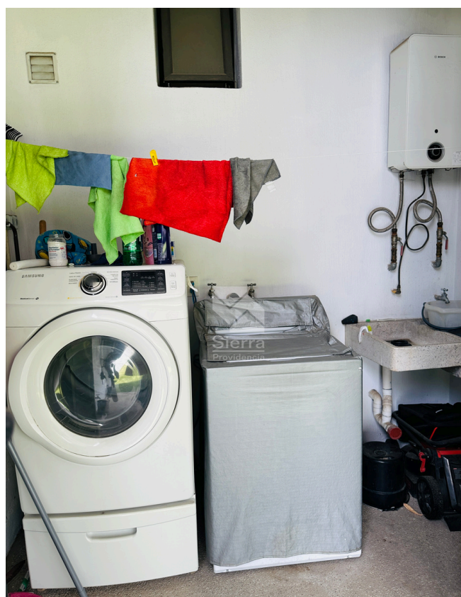
ÁREA DE LAVADO