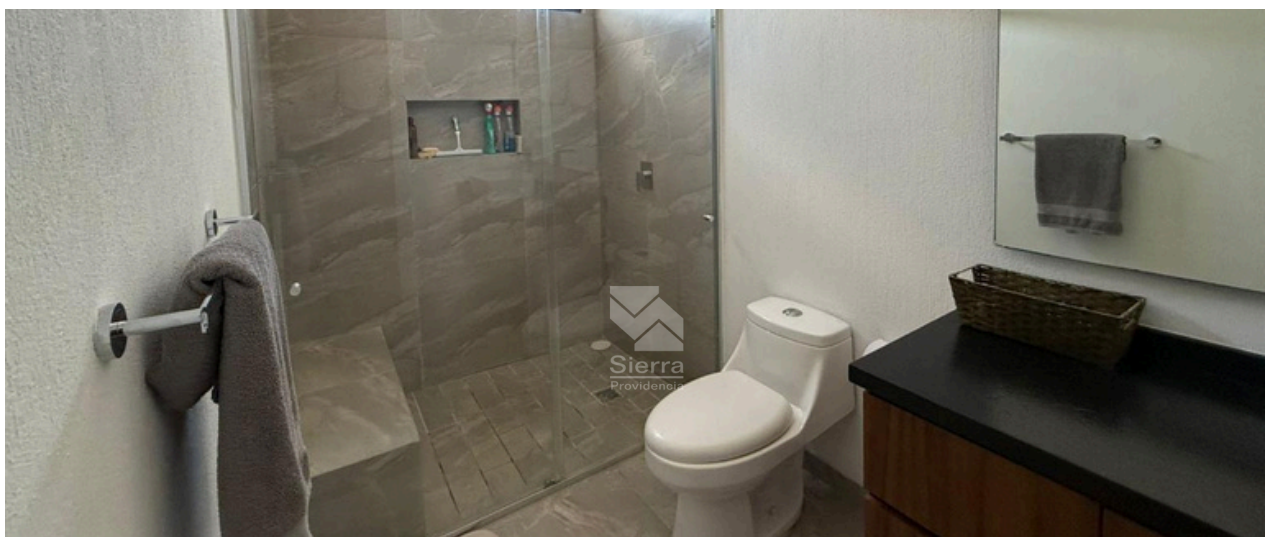
BAÑO COMPLETO COMPARTIDO