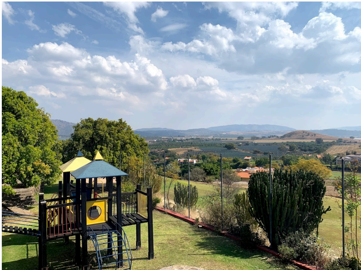
Área de juegos infantiles