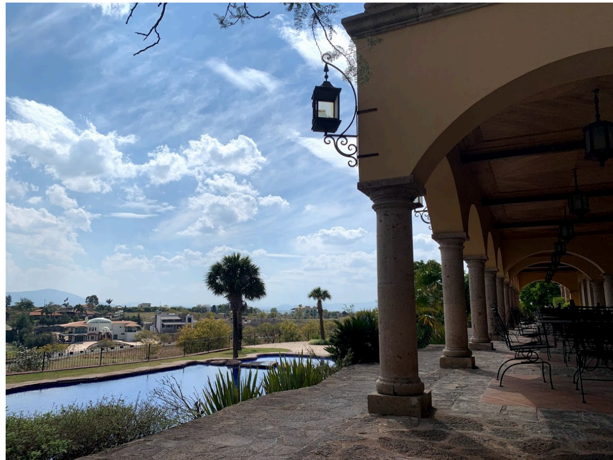
Vista panorámica desde la terraza de la casa club