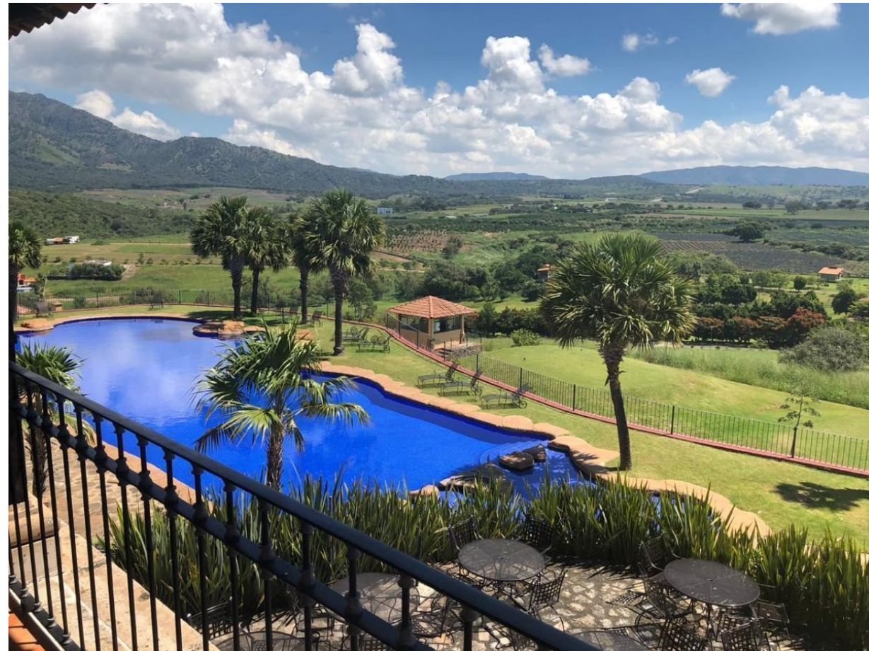
Vistas desde la Casa Club