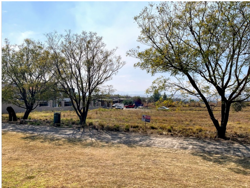
Vista del terreno