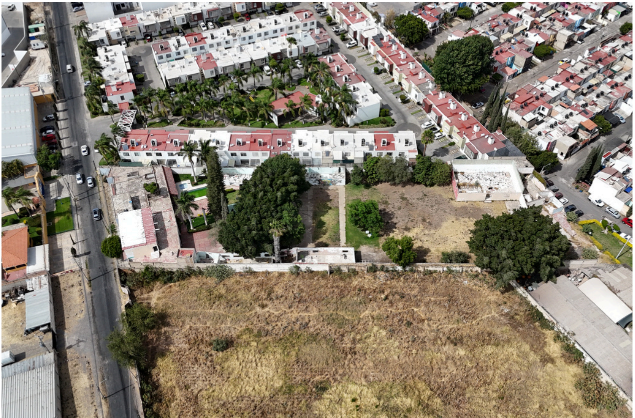
VISTA AÉREA DE TERRENO