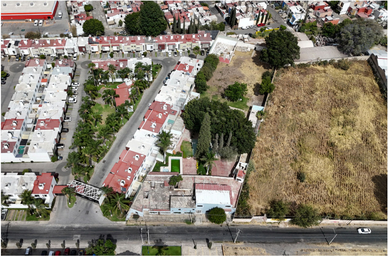
VISTA AÉREA DE TERRENO