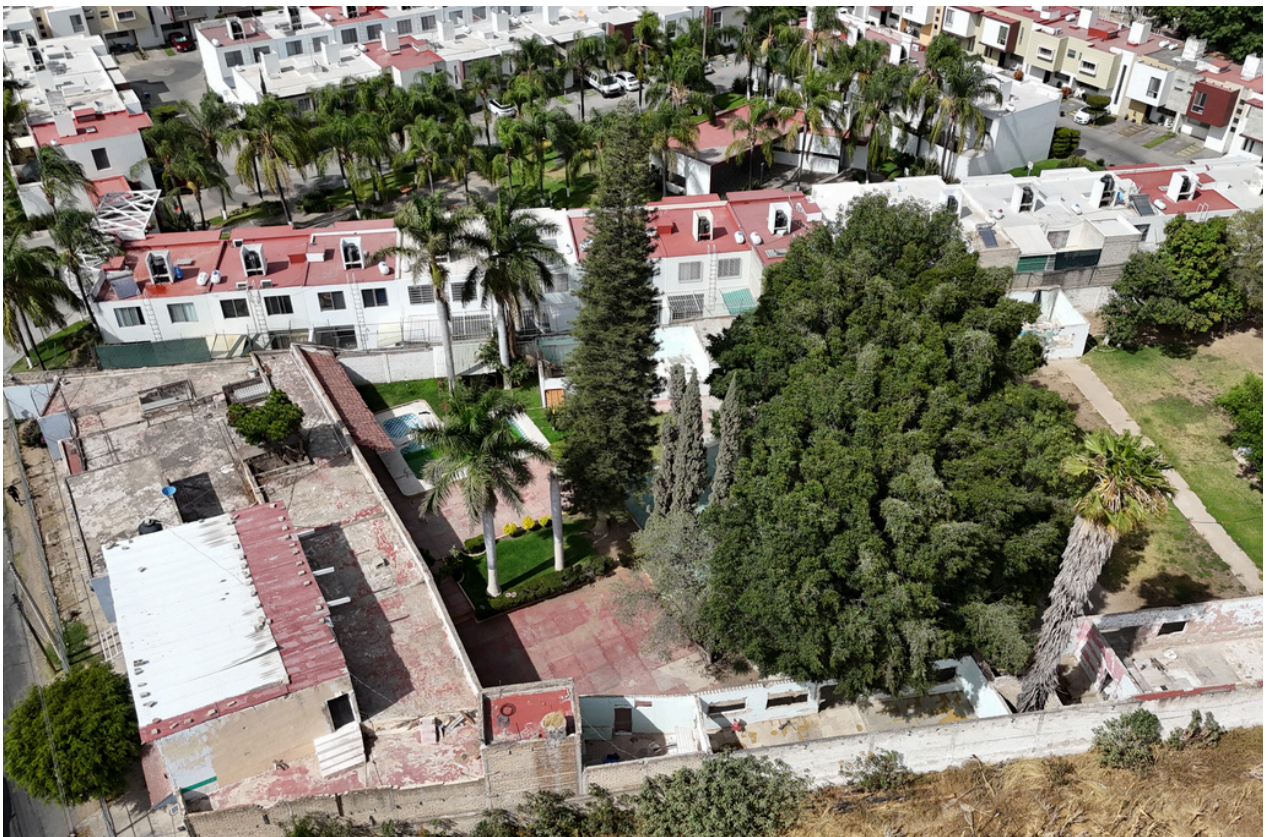
VISTA AÉREA DE TERRENO