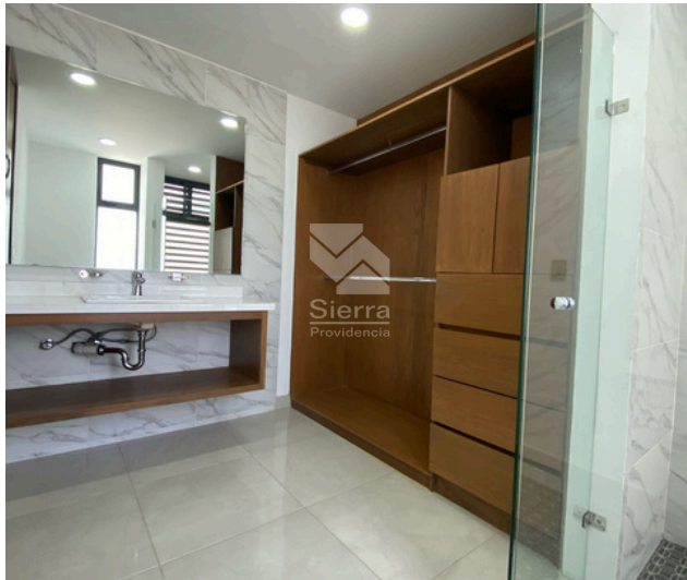
Vestidor - Baño completo