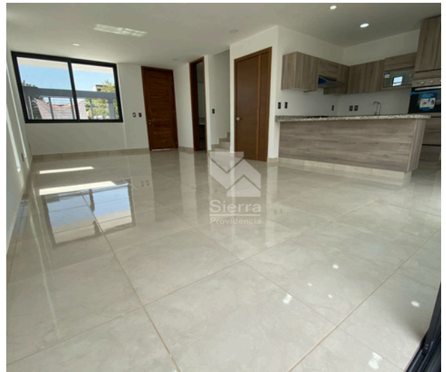
Sala - Comedor