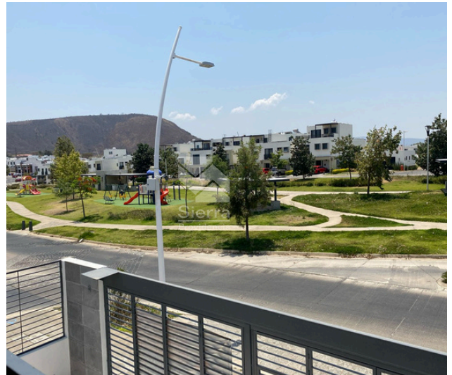
Vista desde balcon