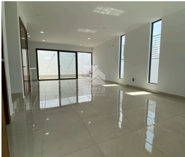
Sala - Comedor