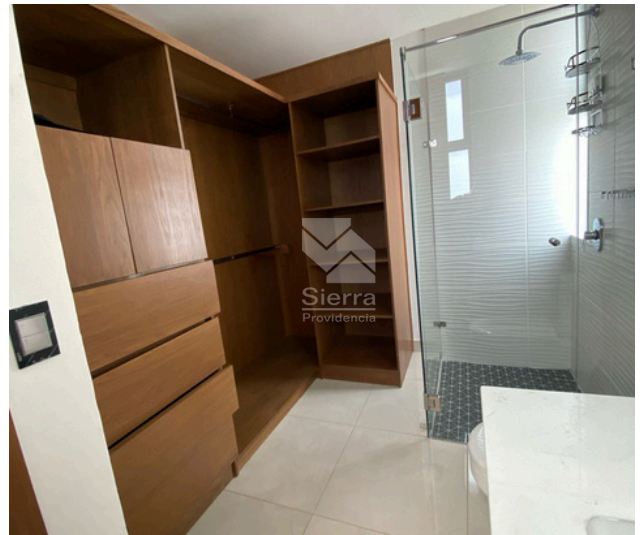
Vestidor - Baño completo