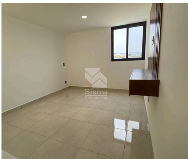
Sala de TV