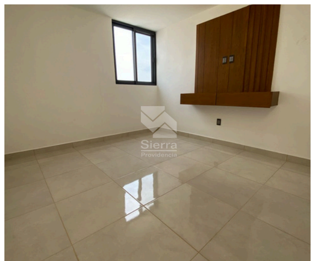
Sala de TV