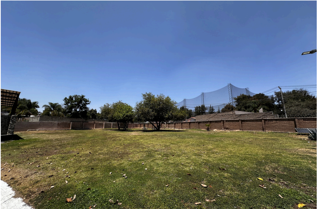
Jardín de uso común