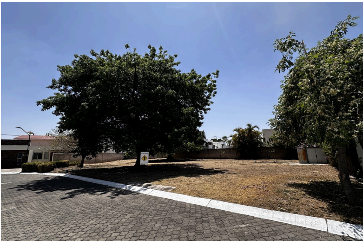
Terreno 16 y 17