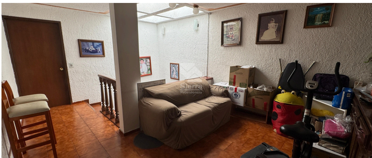
Sala de TV