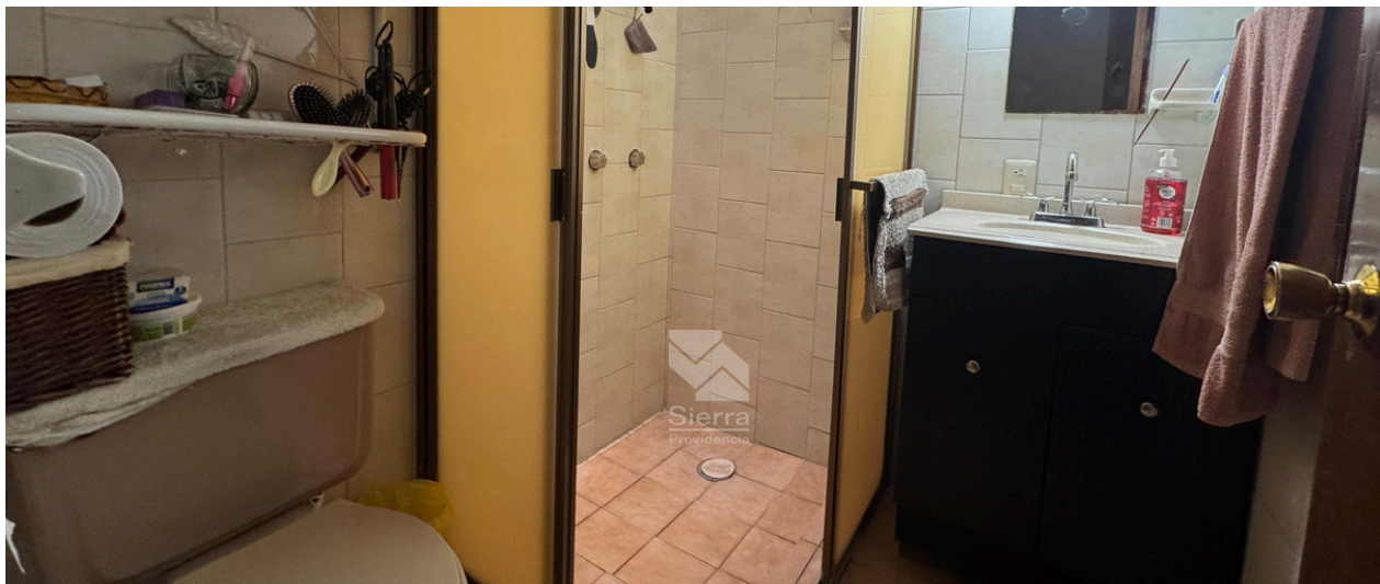
Baño completo recámara principal