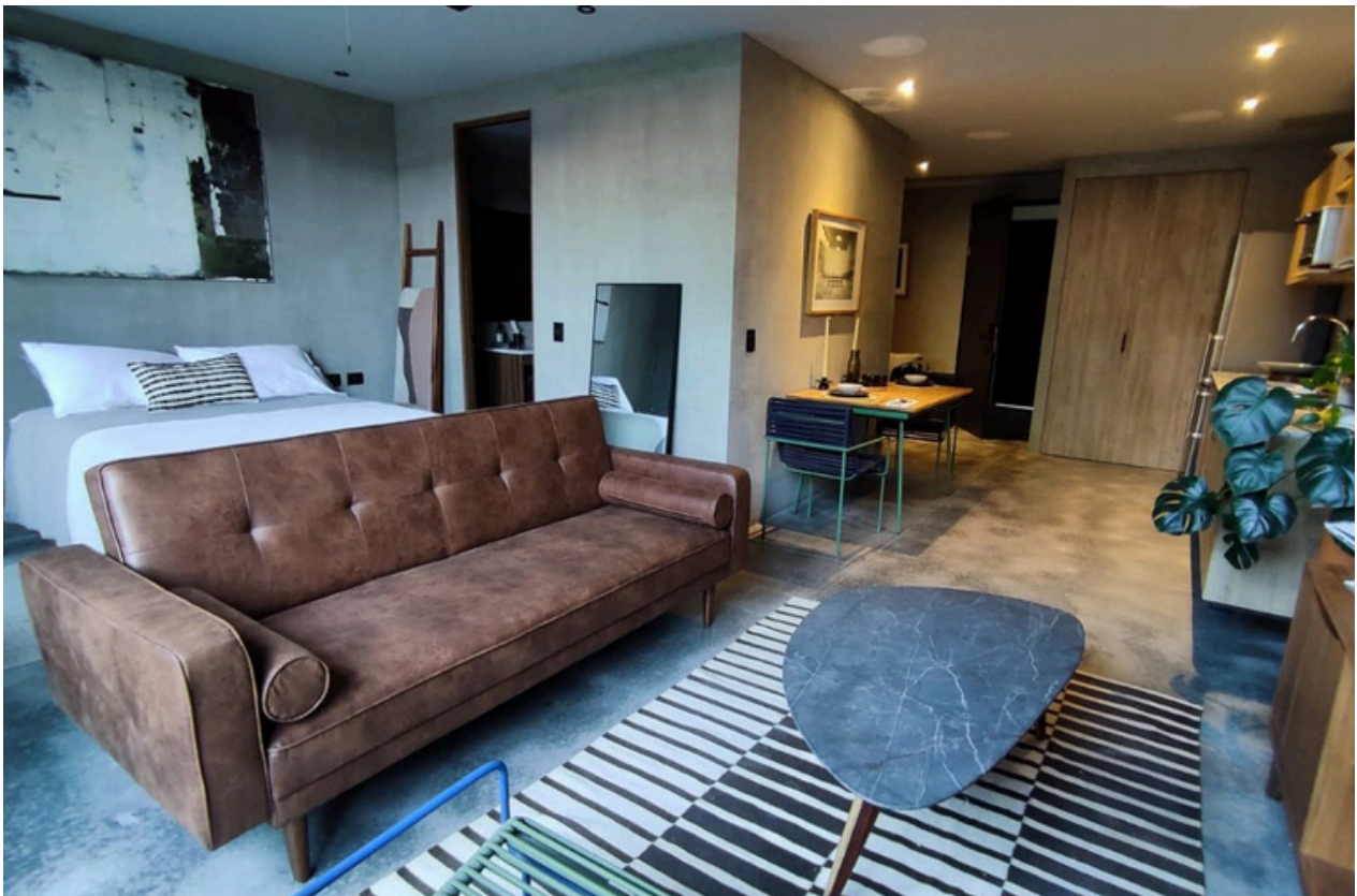
Recámara / sala