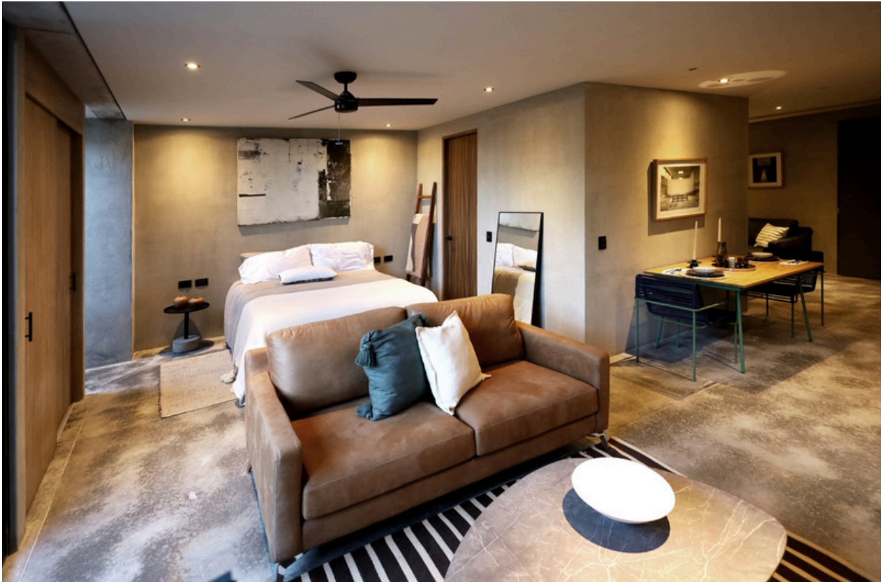
Recámara / sala