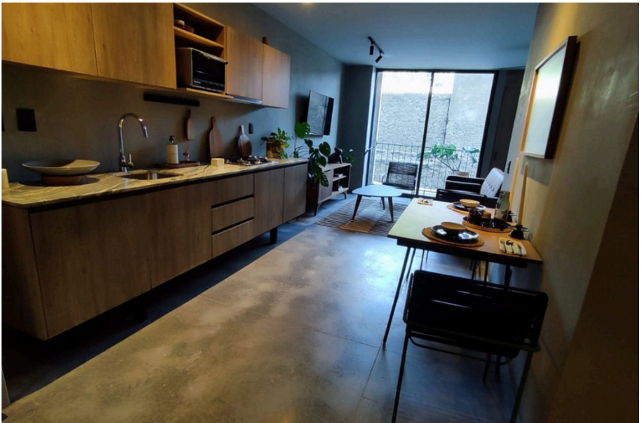
Cocina / comedor