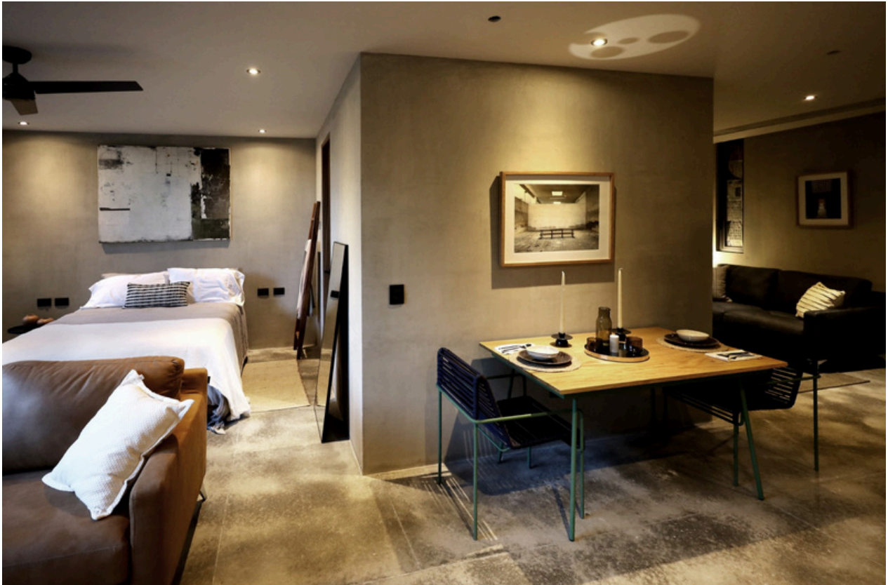
Recámara / Comedor