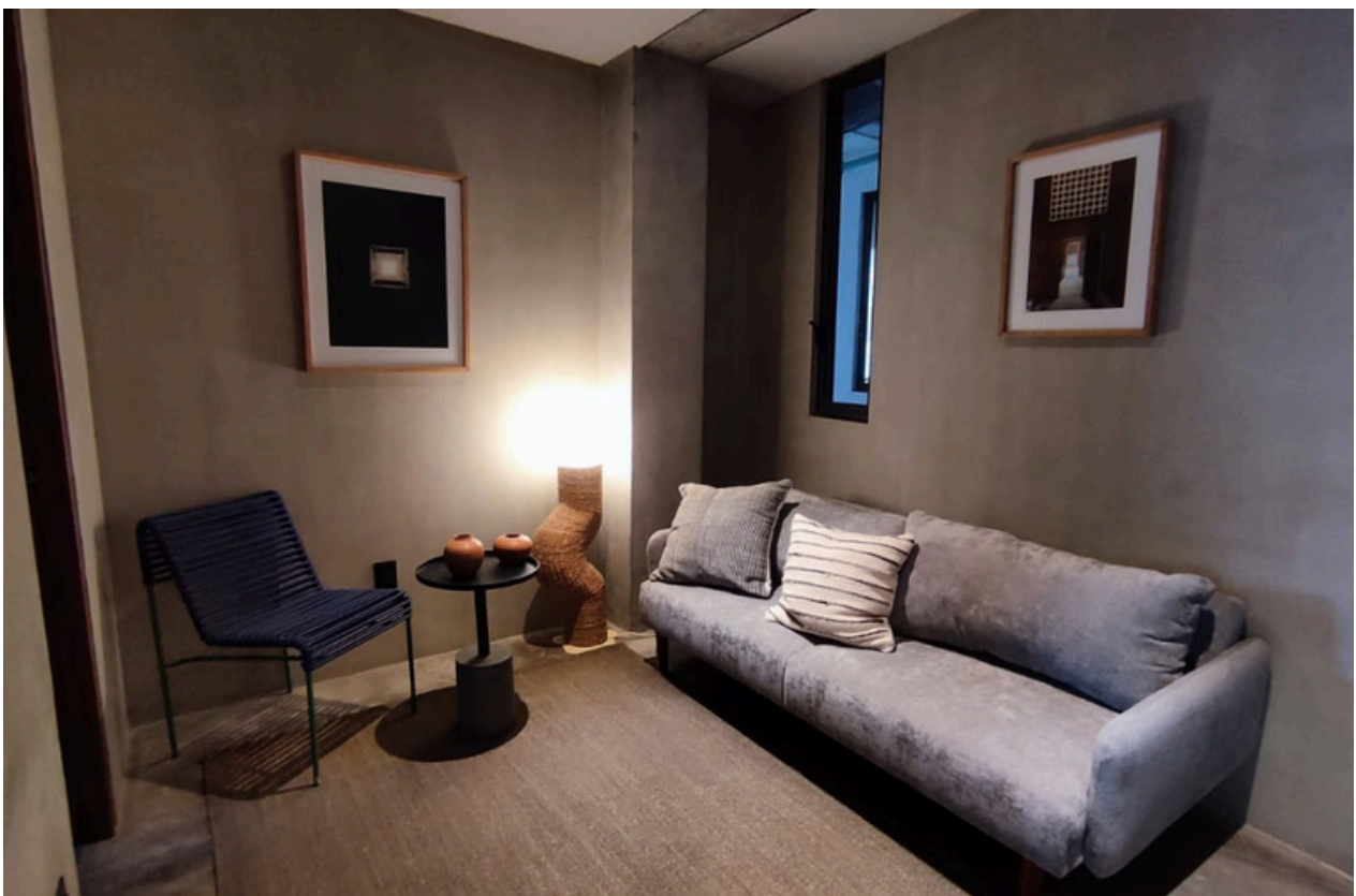
Sala / Área flex