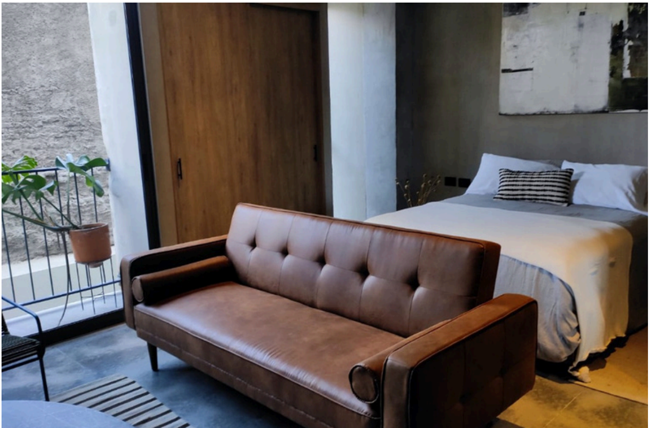
Recámara / Balcón