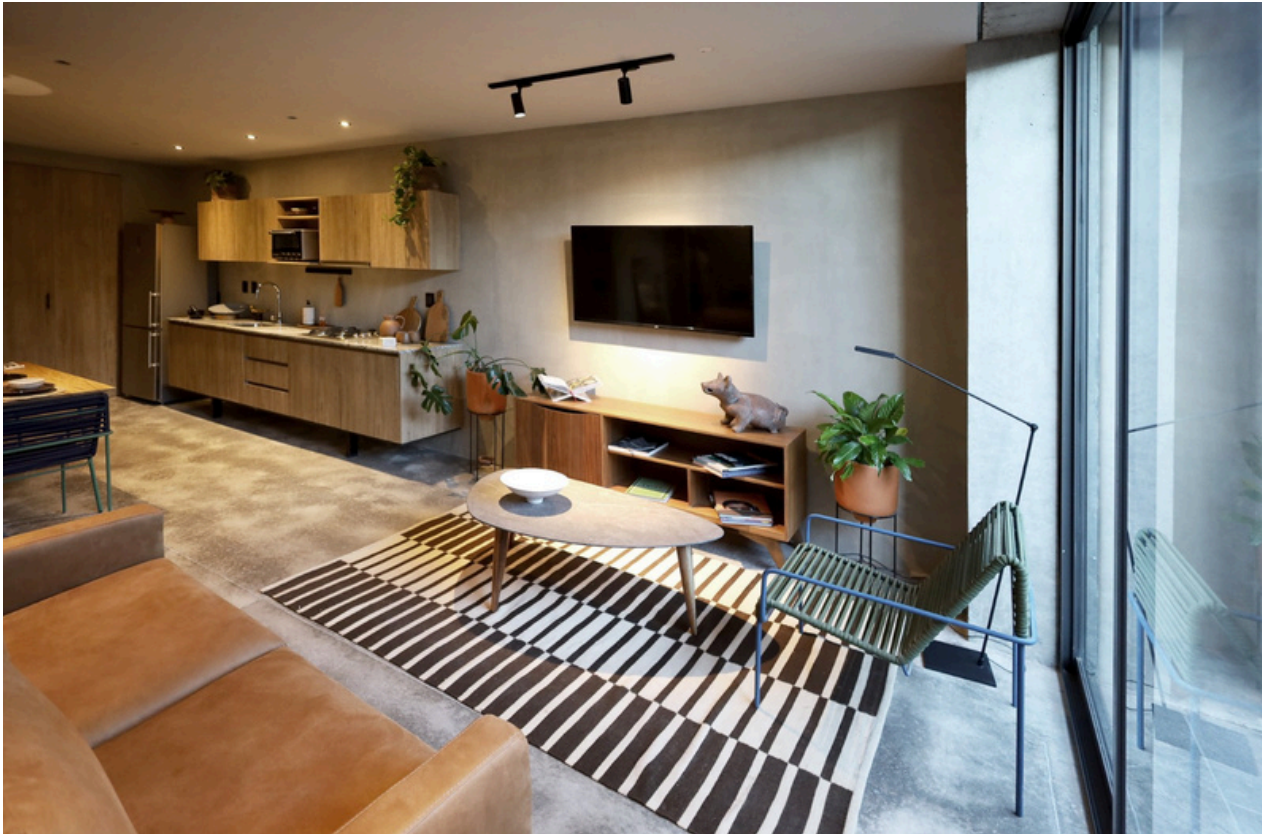
Sala / Cocina