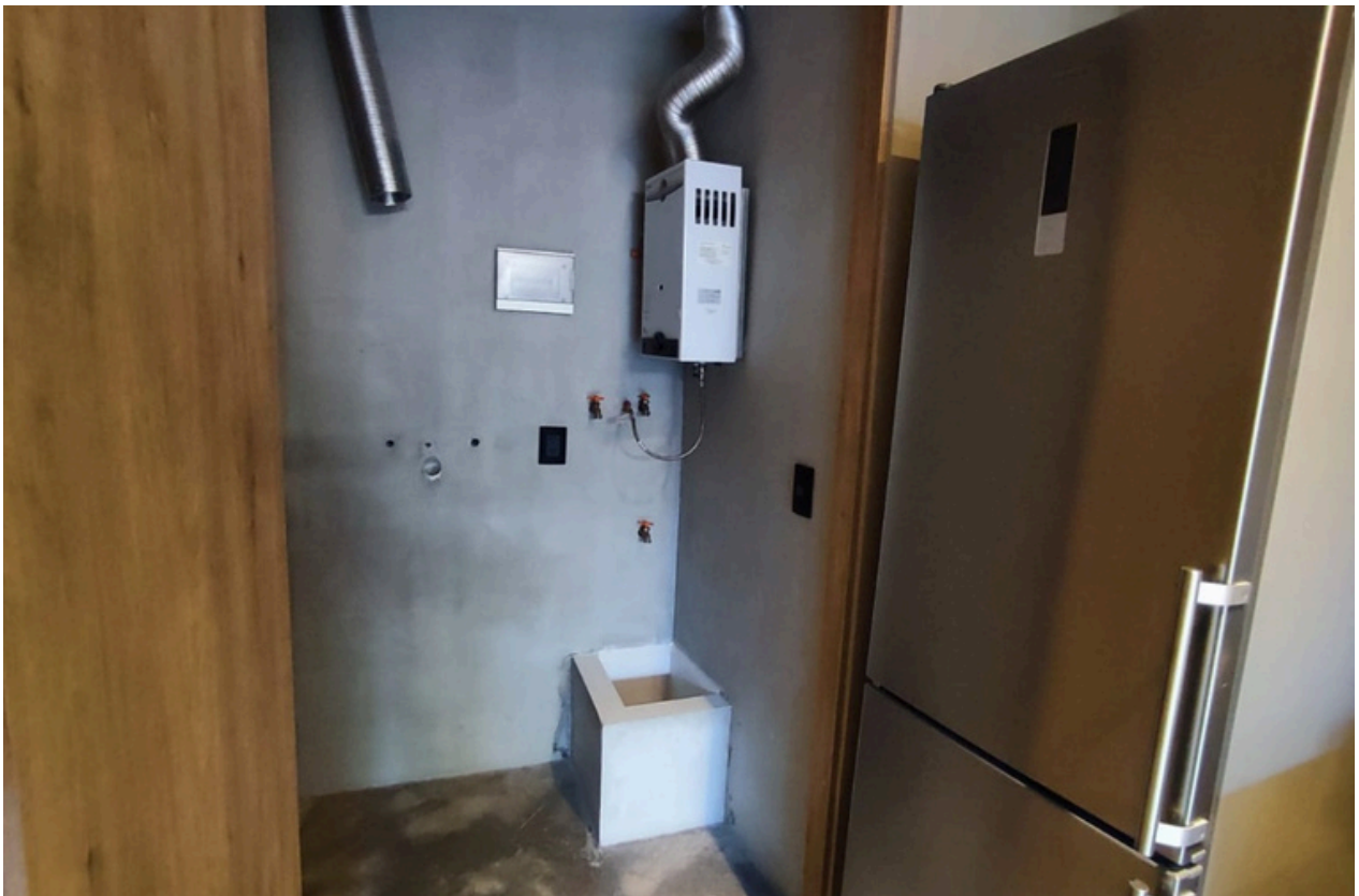
Cuarto de lavado