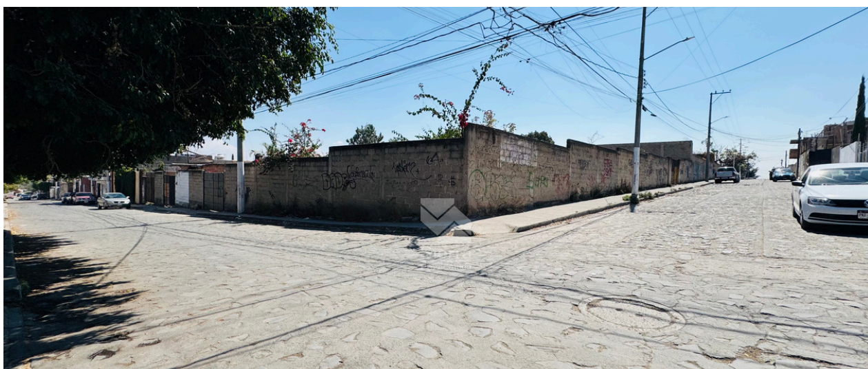
Terreno / Vialidades