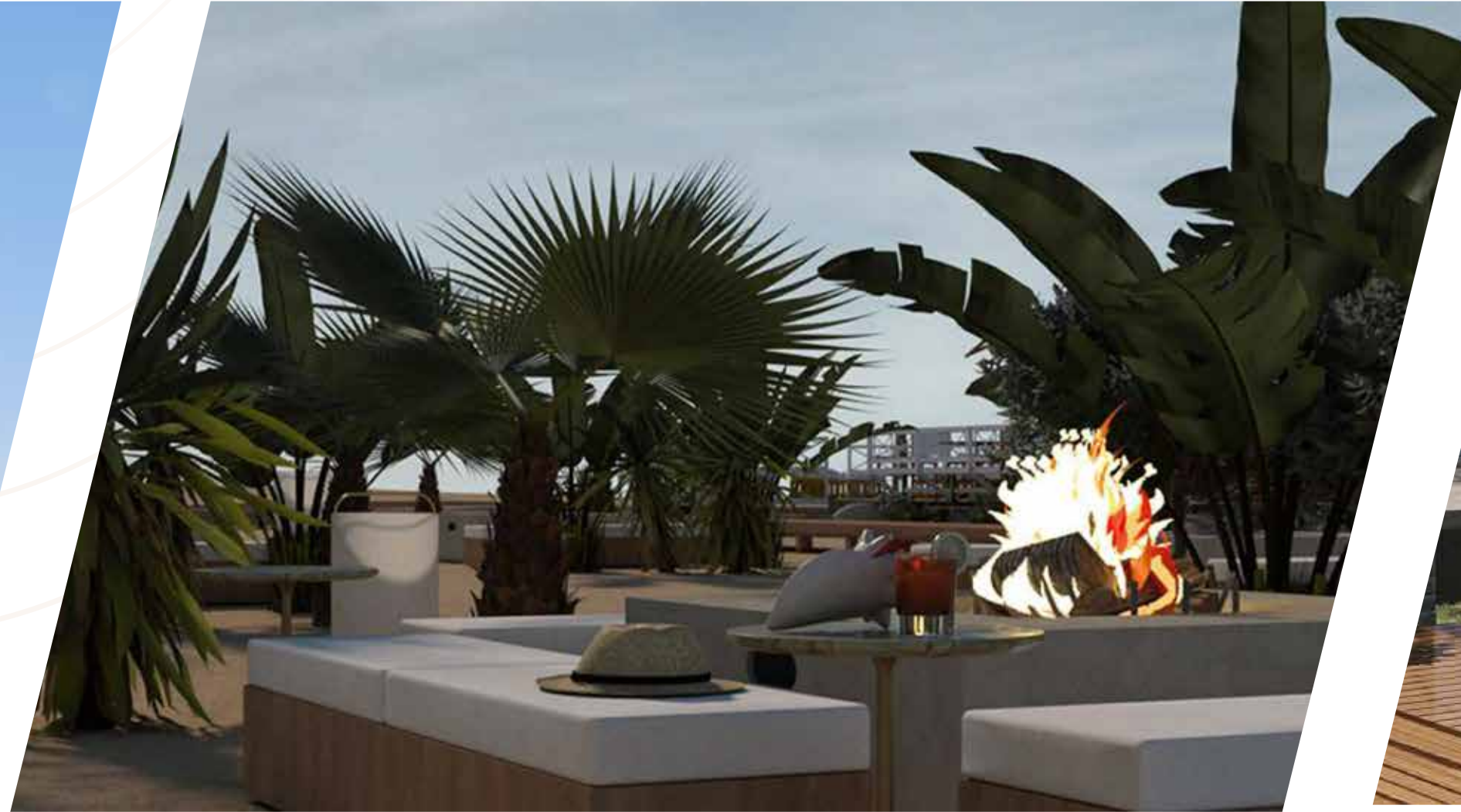
ZONA DE FOGATAS