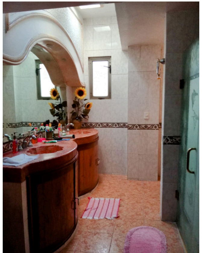
Baño de recámara secundaria