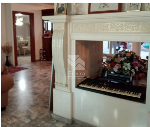
Sala con chimenea