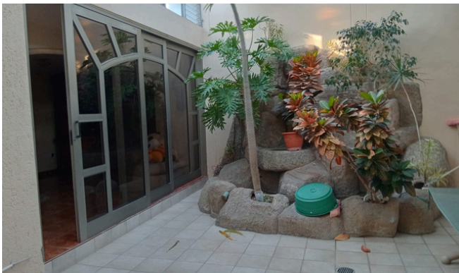
Patio con cascada