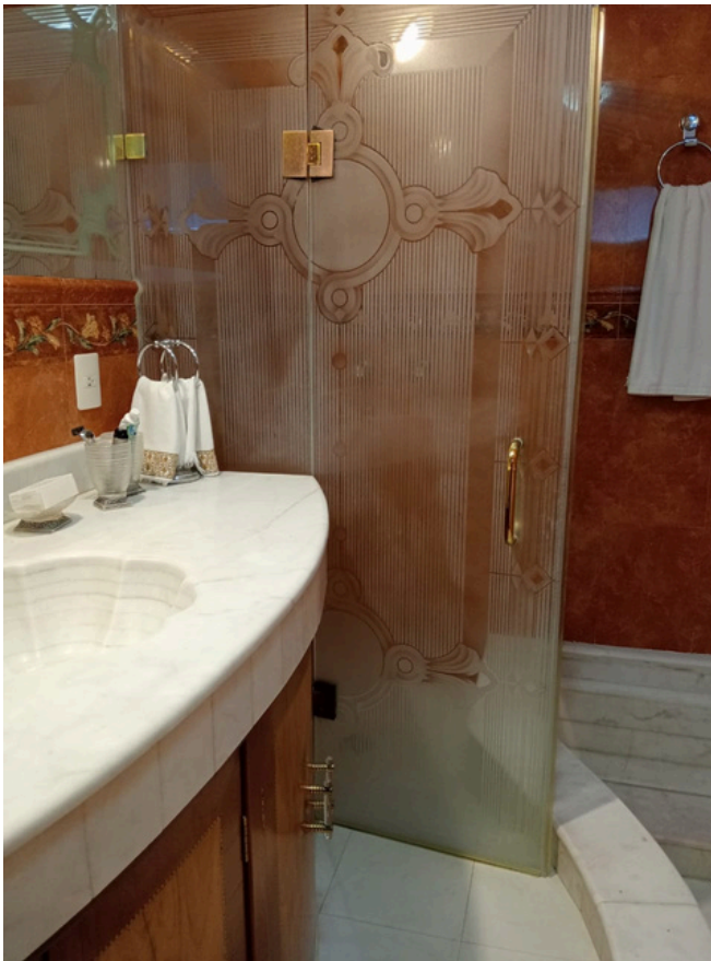
Baño recámara principal