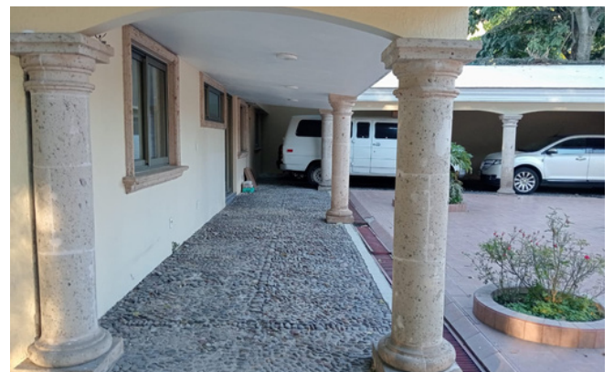
Cochera y terraza