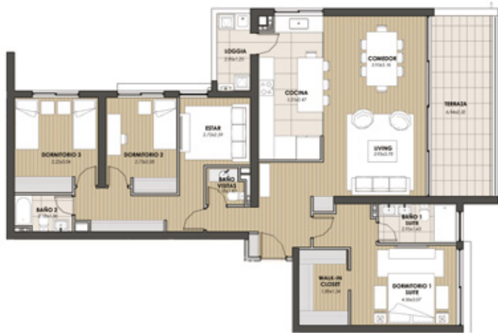
Departamento Tipo 1 Orientación Nor Poniente