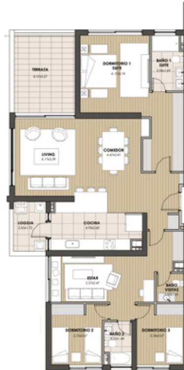
Departamento Tipo 3 Orientación Sur Poniente