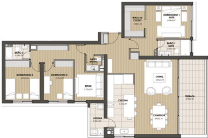
Departamento Tipo 2 Orientación Nor Oriente