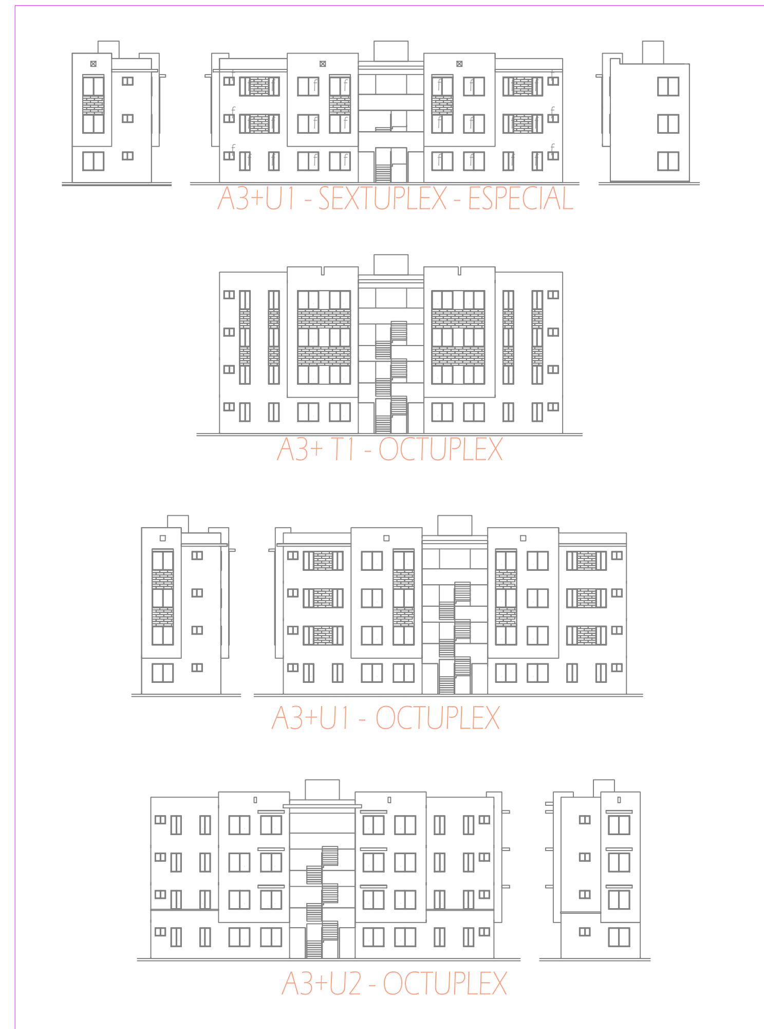
FACHADAS DE VIVIENDA "A3+"