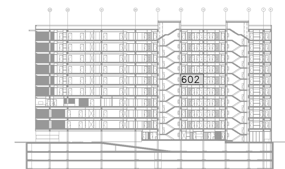
CORTE A ESQUEMATICO TORRE B