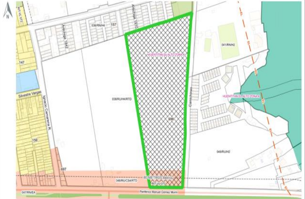
Croquis de Predio