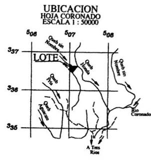
UBICACION HOJA CORONADO ESCALA 1 : 50000

Catastro Nacional 1-2474751 16/11/2009 11:06:53 Reingreso