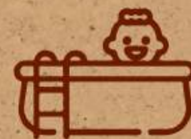
Alberca para niños