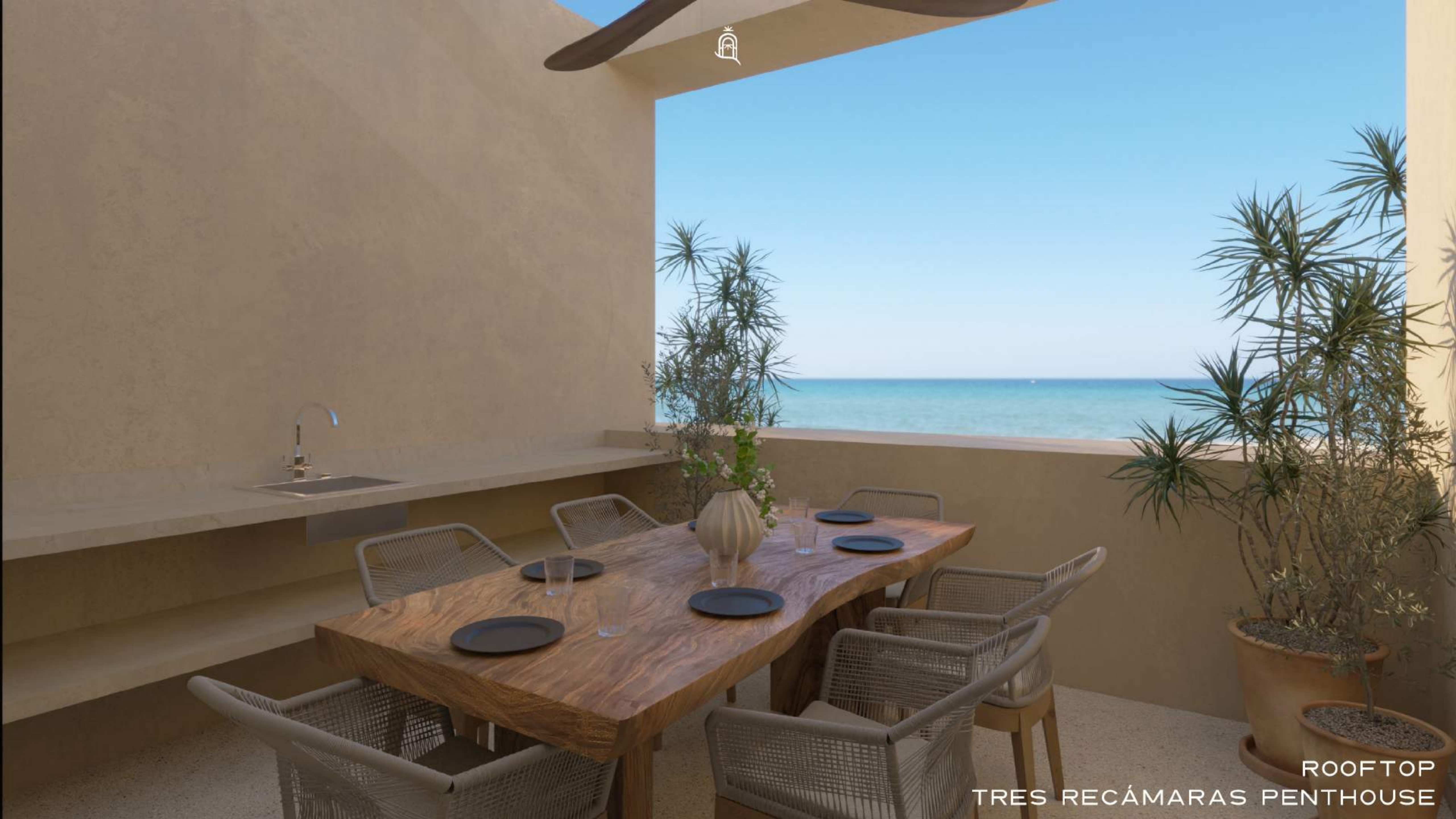
ROOFTOP TRES RECÁMARAS PENTHOUSE