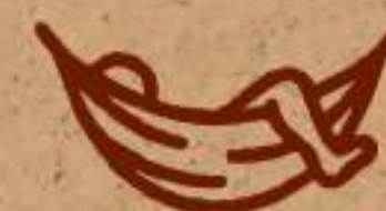
Zona de hamacas