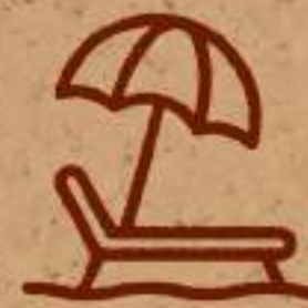
Área de camastros