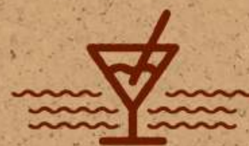
Bar en la alberca