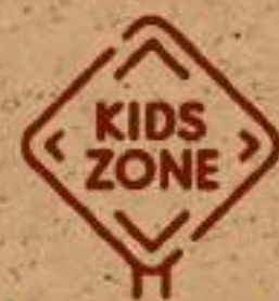
Área de niños