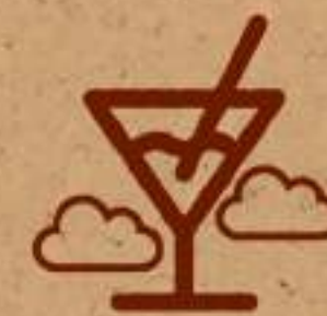
Bar en las alturas