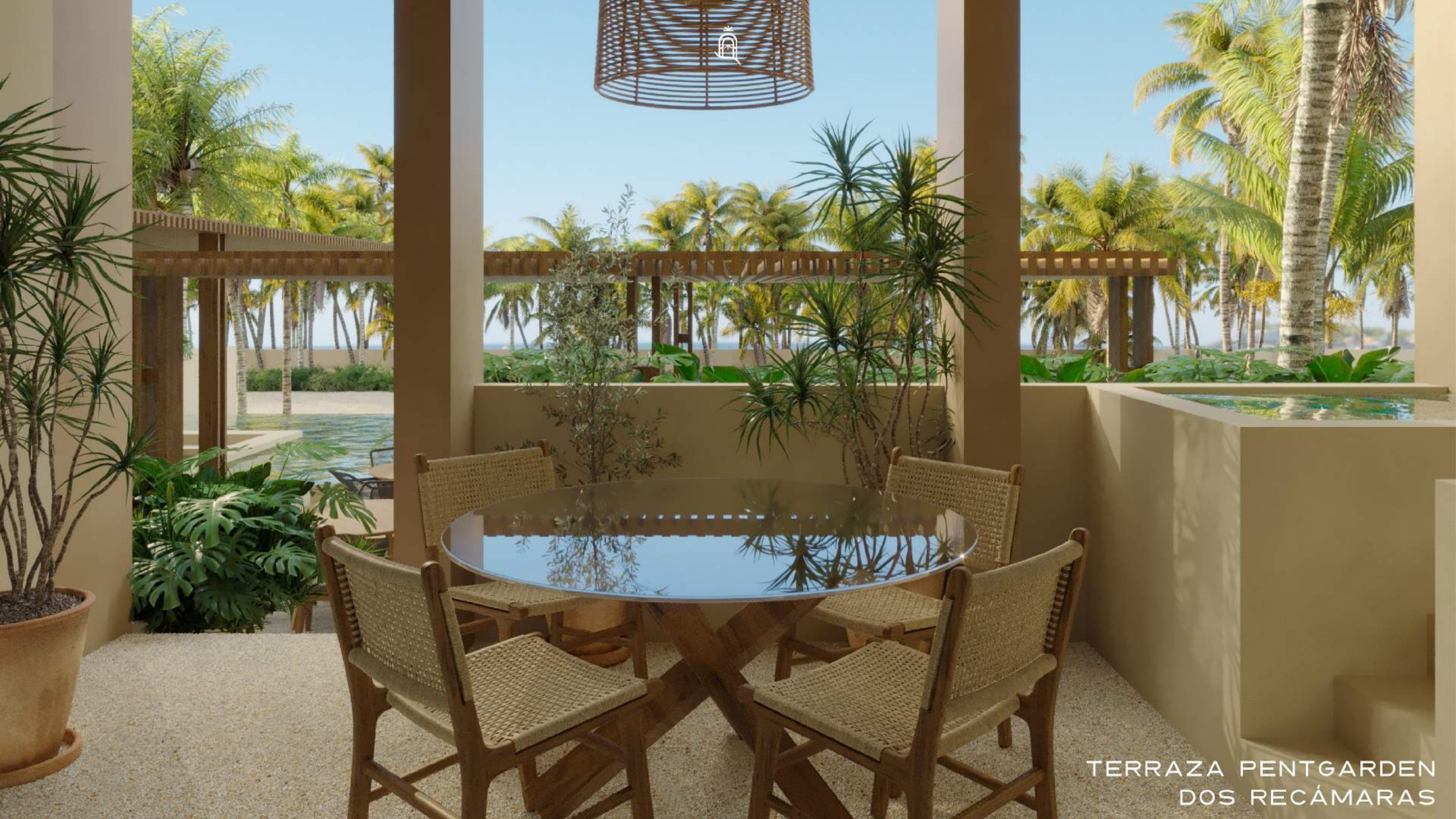
TERRAZA PENTGARDEN DOS RECÁMARAS