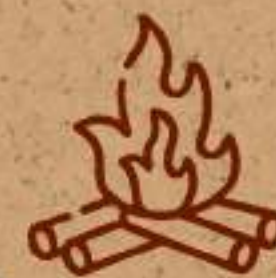
Área de fogata