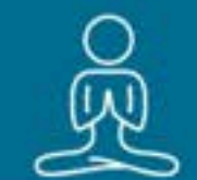
AREA DE YOGA