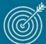
SALÓN DE JUEGOS