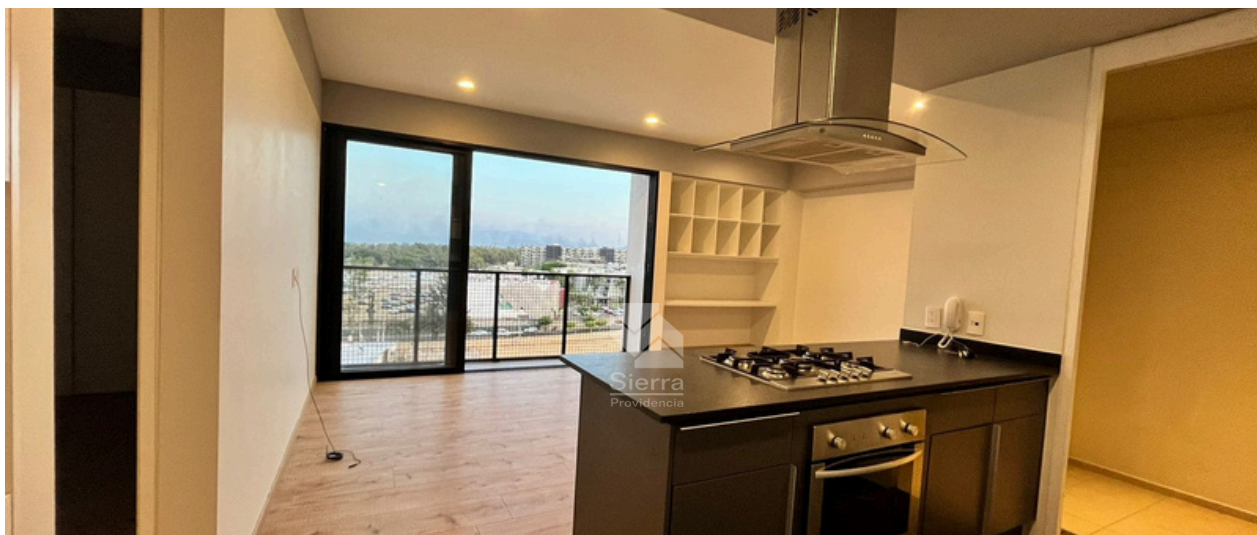
Cocina / Sala comedor