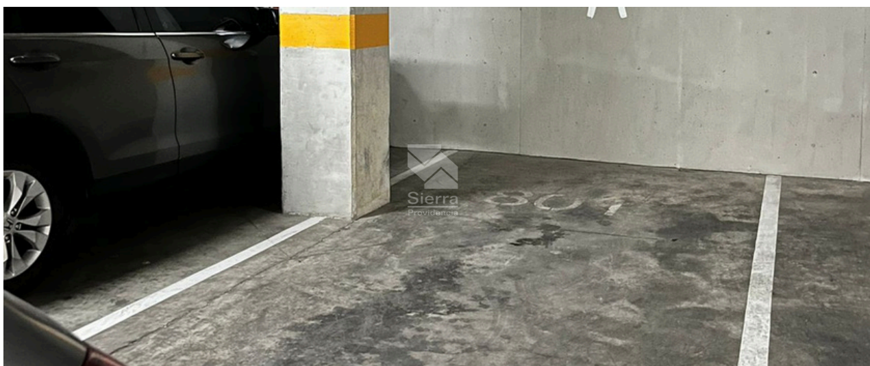
Cajón de estacionamiento