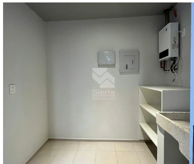
Área de lavado