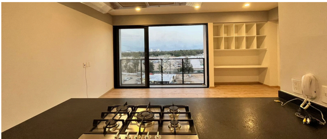
Cocina / Sala comedor