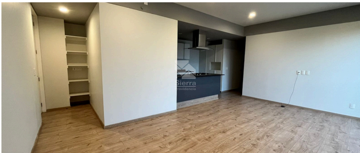
Sala comedor / Cocina / Distribuidor