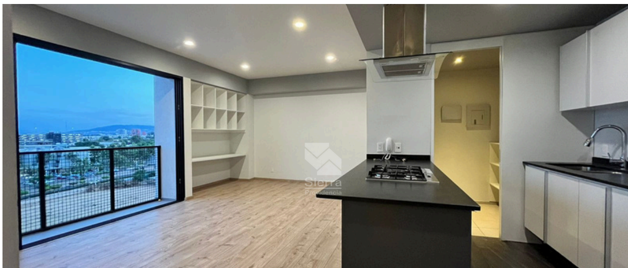
Cocina / Sala comedor