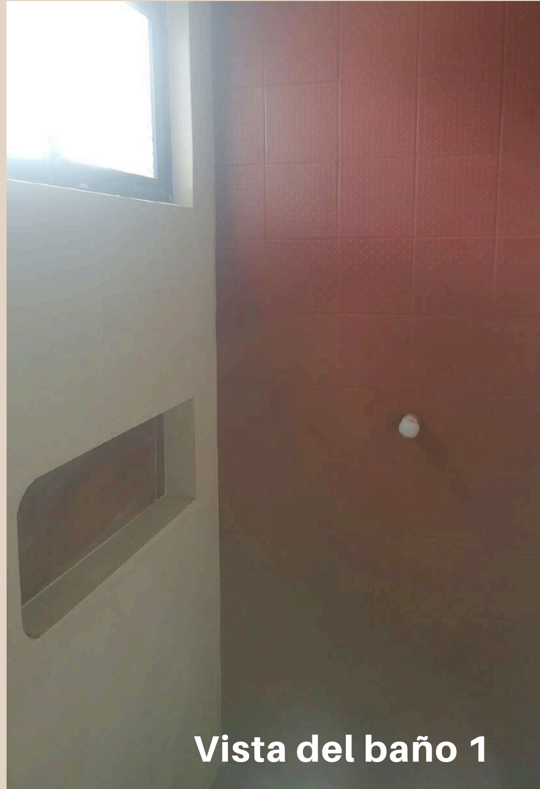
Vista del baño 1