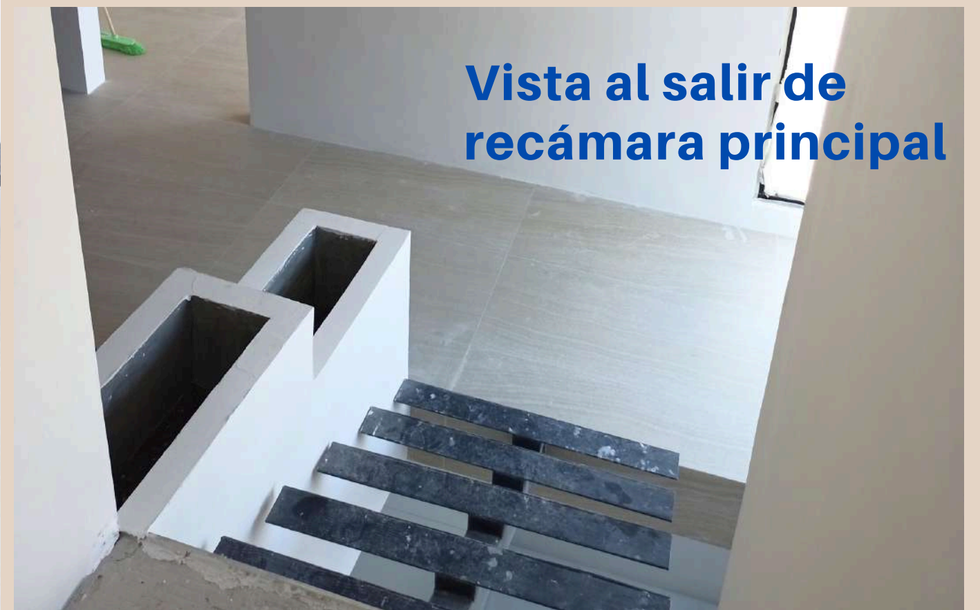
Vista al salir de recámara principal