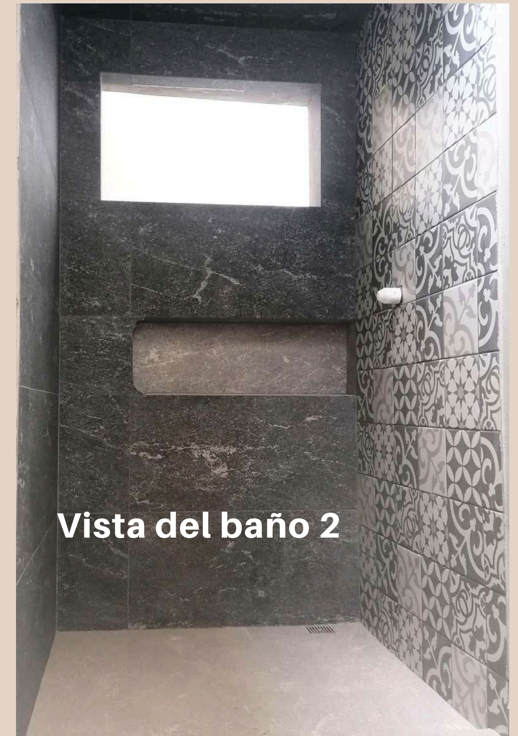
Vista del baño 2