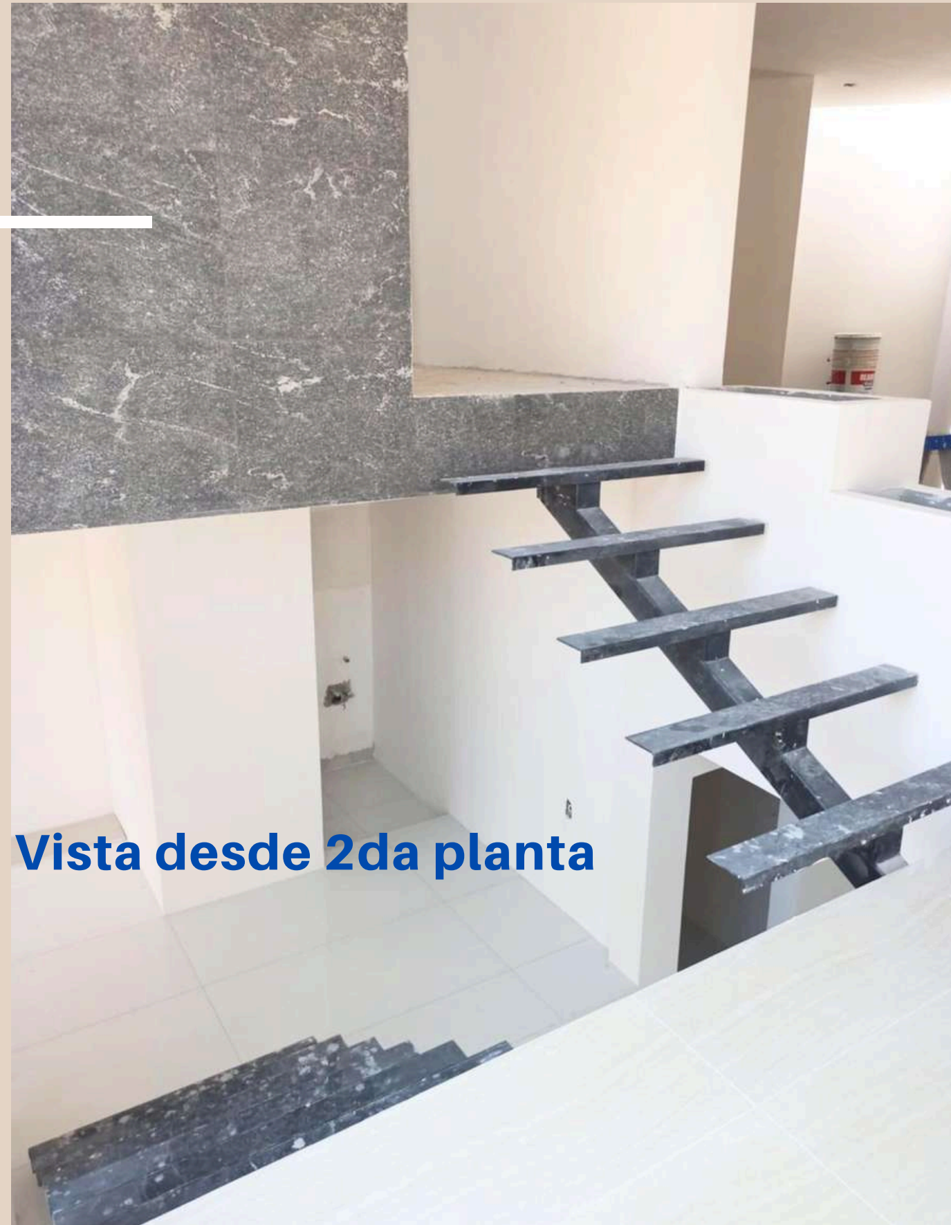
Vista desde 2da planta