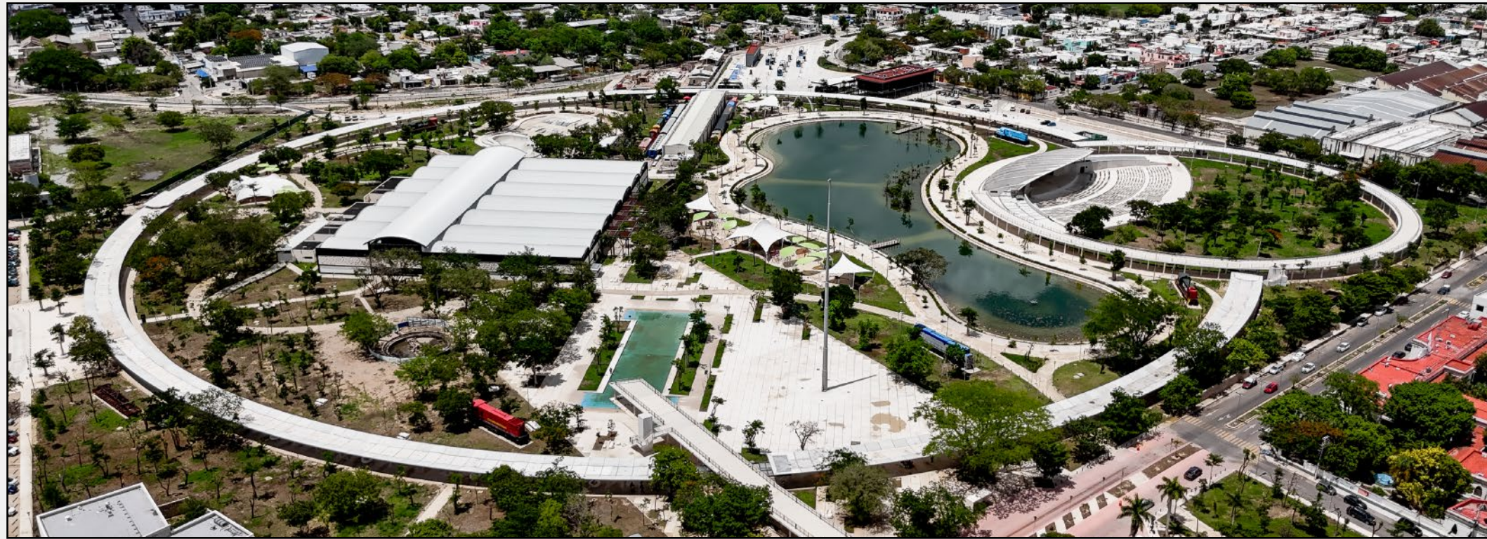
GRAN PARQUE LA PLANCHA