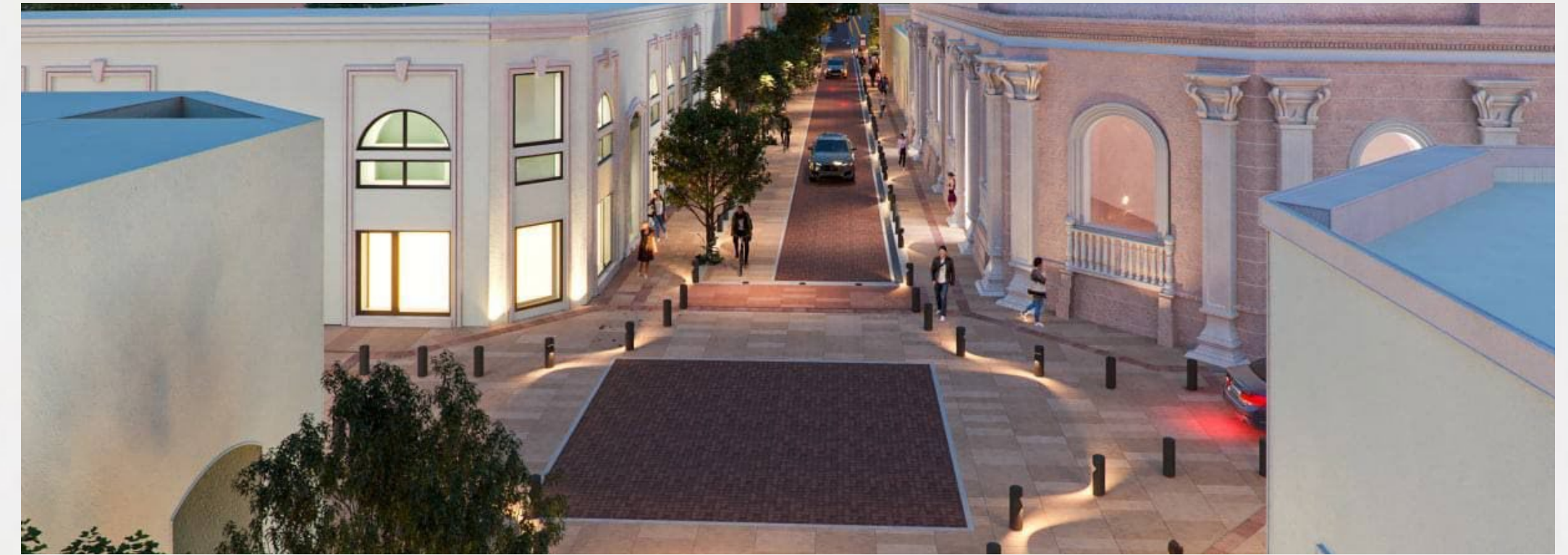
GRAN CORREDOR TURÍSTICO-GASTRONÓMICO