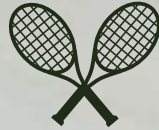
Canchas de Padel