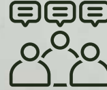
Salón de eventos