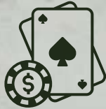
Salón de Póker